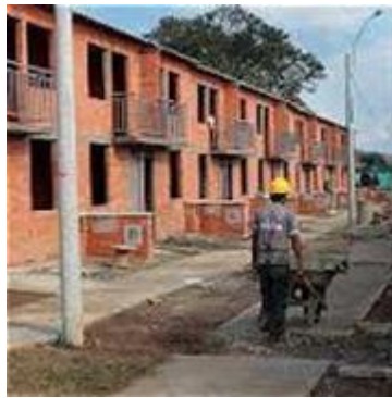
Figura 3. Viviendas para Reinsertados.

Los reinsertados, encuentran que derechos básicos como la vivienda están siendo vulnerados, debido a que por su baja preparación educativa para la realización de una actividad económica que encaje dentro de los estándares sociales requeridos para desempeñarse laboralmente por las empresas públicas y privadas, no tienen unos ingresos que les permitan adquirir un lugar digno para vivir, y sentir apropiación e identidad para mejorar su nivel de vida.