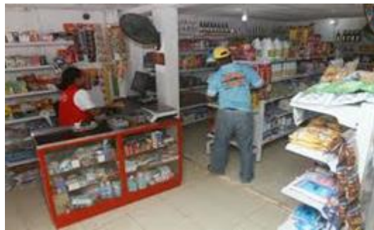
Figura 4. Empleo para Reinsertados.

Siendo estas cifras el reflejo del temor que existe en los empresarios al momento de vincular a dichas personas ya que no tienen las herramientas necesarias sobre el proceso y es en este punto donde está el reto de estas empresas al tomar conciencia que es mejor darle empleo a dichas personas trayendo consigo beneficios tanto individuales como colectivos trabajen a que estas personas sigan siendo parte del conflicto armado en el país. (Lozano, 2012).