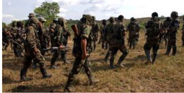
Figura 1. Reintegración Comunitaria.

La reintegración comunitaria depende del apoyo que reciben los reinsertados de sus familias y comunidades. Comúnmente, estas personas reinsertadas “regresan a entornos sociales extremadamente difíciles, en los que es muy probable que los vean como una carga adicional para la comunidad” (Caramés, S.F.). Es por esto que la ACR busca llegar a más municipios del país con estas actividades de reintegración con enfoque comunitario, para reducir estos estigmas hacia estos grupos al margen de la ley y llegar a una construcción de paz.