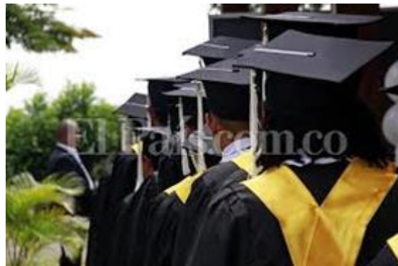
Figura 5. Capacitación para Reinsertados.

El gobierno ha adquirido múltiples compromisos con las personas reinsertadas, donde busca desarrollar simultáneamente programas de capacitación no formal, educación técnico profesional, educación superior y asesoría empresarial. Esta preparación se debe dirigir a labores u oficios realmente requeridos por el mercado laboral donde la formación entregada sea precisa y profunda y adecuada a las capacidades de la persona reinsertada y de acuerdo a las necesidades que demanda las empresas públicas y privadas; para que puedan tener una permanencia a largo plazo en el ámbito laboral. (Fundación Ideas para la Paz, 2014).