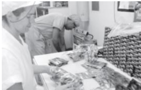
Figura 2. Programa de Reinserción.

“Se quiso llevar a cabo una mesa de trabajo que se convierta en un comité de acompañamiento al proceso de reintegración en el Huila. Hace tres años que se creó la Alta Consejería para la reintegración de la Presidencia de la República y en este departamento venimos desarrollando un proceso de acompañamiento al proceso de reintegración de hombres y mujeres que se han desmovilizado con sus familias y las comunidades”. (Gobernación del Huila, s.f.).