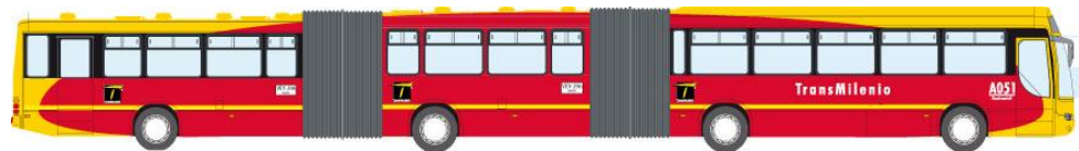
Figura 5. Vehículo Biarticulado Transmilenio.

Biarticulado: Estos Vehículos cuentan con dos articulaciones. Cuenta con tableros electrónicos internos y externos y sistema de voz electrónico para indicar próximas paradas. Los buses biarticulados de Transmilenio tienen una longitud de 27 metros y 20 centímetros convirtiéndose así, en el bus biarticulado más largo del mundo. Capacidad promedio es de 250 pasajeros. (Transmilenio S.A., 2015).