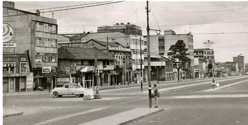
Figura 16. Avenida Caracas con calle 13 en 1964.

Del ferrocarril a las grandes avenidas, conocida como avenida Caracas o carrera 14, esta es una de las vías más antiguas de la ciudad. Fue diseñada por Pedro Nel Gómez, comunicaba a la capital con Chapinero y llegaba a los municipios del norte de la sabana de Bogotá.