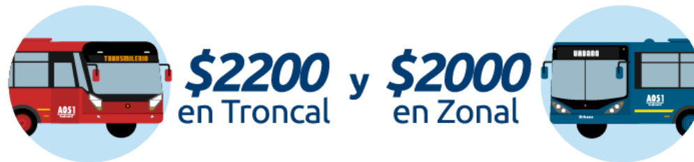
Figura 11. Valor del pasaje para servicios troncales y Zonales