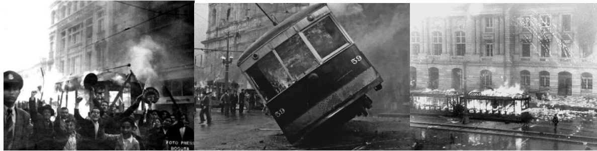
Figura 1. Buses de Bogotá.