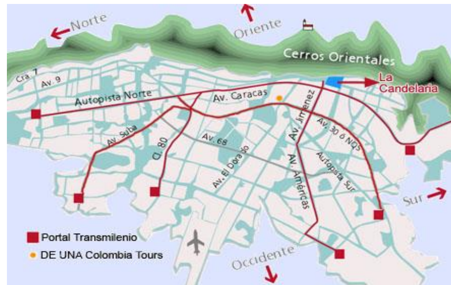
Figura 2. Mapa de Bogotá