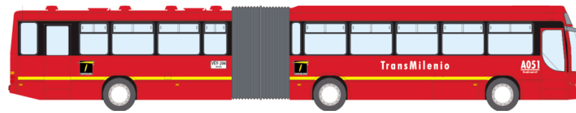
Figura 4. Vehículo Articulado Transmilenio