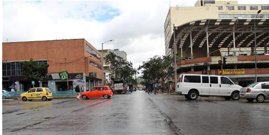
Figura 21. Carrera 13 con calle 19 en 2016.