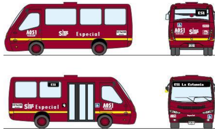
Figura 10. Vehículo Especial SITP