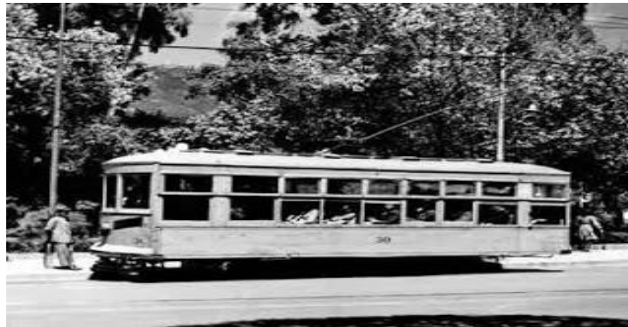
Figura 3. Tranvía de Bogotá

Al interior de la ciudad desde finales del siglo XIX, hasta la actualidad el transporte público de Bogotá ha tenido muchas transformaciones pasando por varios modelos, “iniciando en 1884 cuando se inaugura el primer tranvía jalado por mulas, el cual fue manejado por la empresa Bogotá City Railway Company, operación que duró hasta 1910, cuando llegaron los tranvías eléctricos; sistema que permitió reducir considerablemente tiempos de viaje, recorrer mayores distancias y ampliar cobertura del servicio a otras localidades apartadas del centro de la ciudad”. (Asprilla y Rey , 2013. Vol. 9, Núm. 1 ). Las rutas en el tranvía se identificaban por colores y ayudaban a la ubicación de las personas ya que en su mayoría eran analfabetas, esto dio como resultado mejora en las condiciones y bienestar para la ciudadanía.