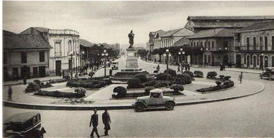
Figura 20. Carrera 13, desde la plaza de San Victorino en 1930.