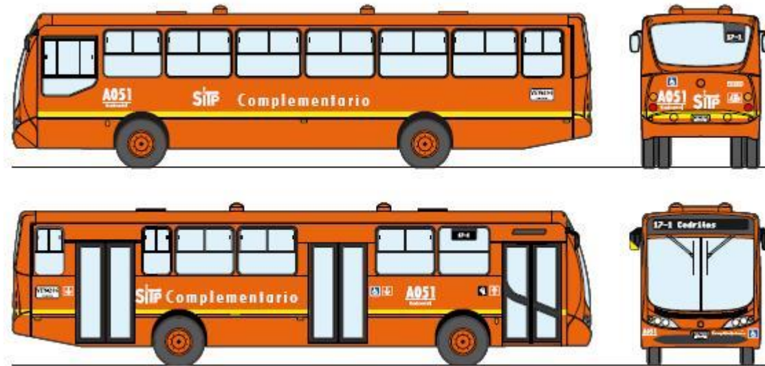
Figura 9. Vehículo de Servicio Complementary SITP