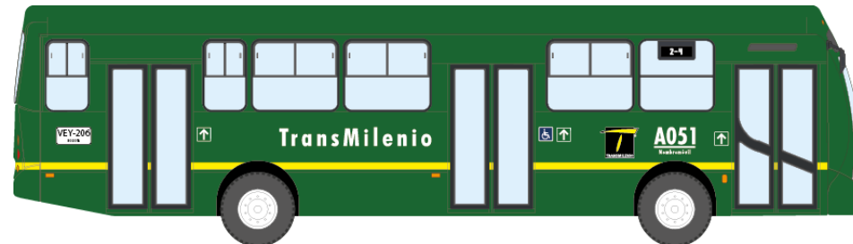
Figura 7. Vehículo Alimentador Transmilenio

Nota: Recuperado de (Transmilenio S.A., 2015).