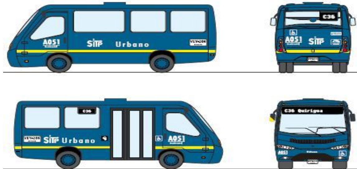
Figura 8, Vehículo de servicio urbano o zonal SITP