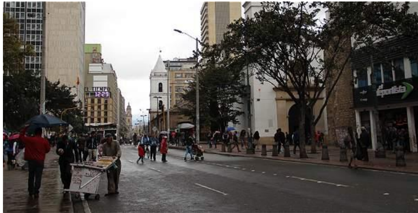
Figura 19. Carrera Séptima, frente al parque Santander en 2016.