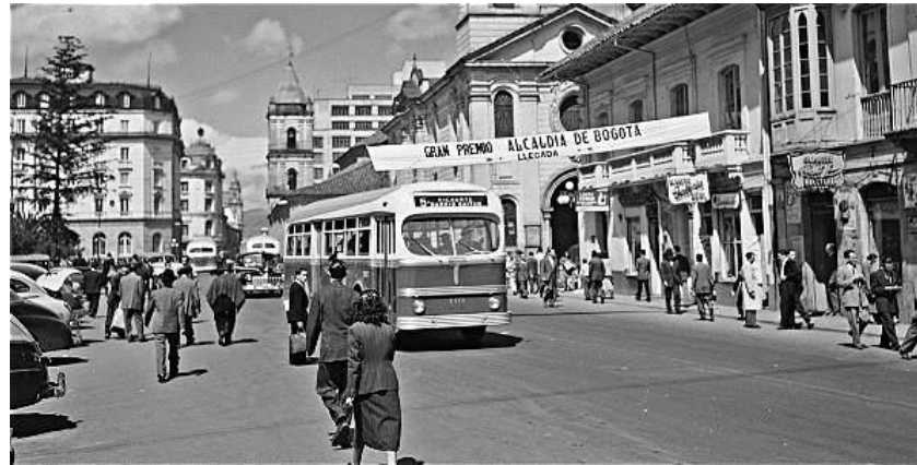
Figura 18. Carrera Séptima, frente al parque Santander en 1952.