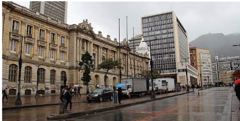
Figura 15. Avenida Jiménez con carrera séptima en 2016.

El primer pavimento, según el ingeniero Cipriano Londoño, se construyó en la plaza de Bolívar, en el centro, entre 1890 y 1893. Pero por la poca “técnica para la obtención del asfalto, la falta de correcta distribución del pavimento y el uso de cascajo en vez de arena, entre otras, hubo inconformidad”.