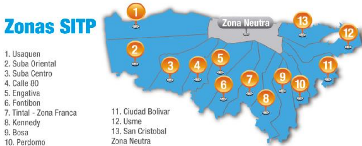
Figura 6. Zonas del SITP: División en la ciudad de Bogotá del SITP, Zonas Operacionales y zona neutra.