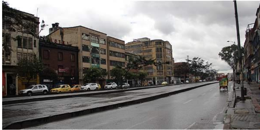
Figura 17. Avenida Caracas con calle 19 en 2016.

urbanista que se llamó Karl Bruner; él hizo el trazado de la vía. Se eliminó el ferrocarril y se construyó la Caracas. Eran tiempos más modernos y se construían avenidas”, dijo Alfredo Barón.