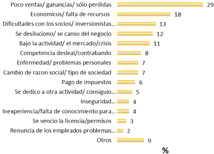
Figura 1. Razones para liquidar empresas

Fuente: Encuesta sobre las Causas de la Liquidación de Empresas en Bogotá. Cámara de Comercio de Bogotá - Centro Nacional de Consultoría. 2008. p. 31.