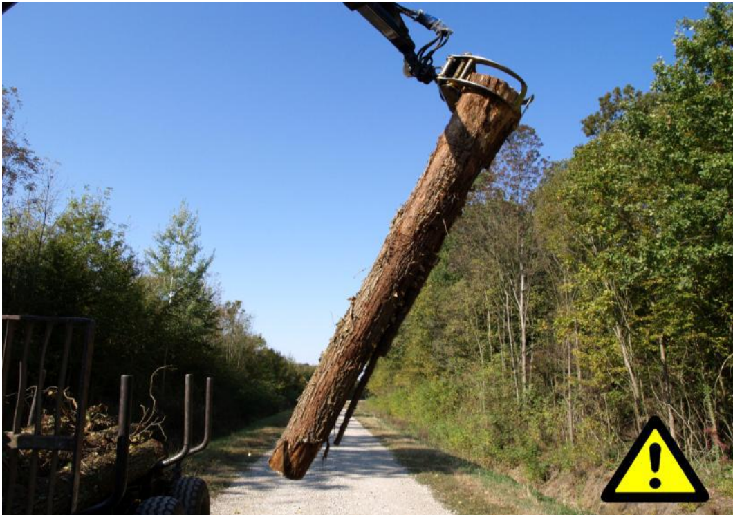
Slika 6. Neispravno obuhvaćen trupac