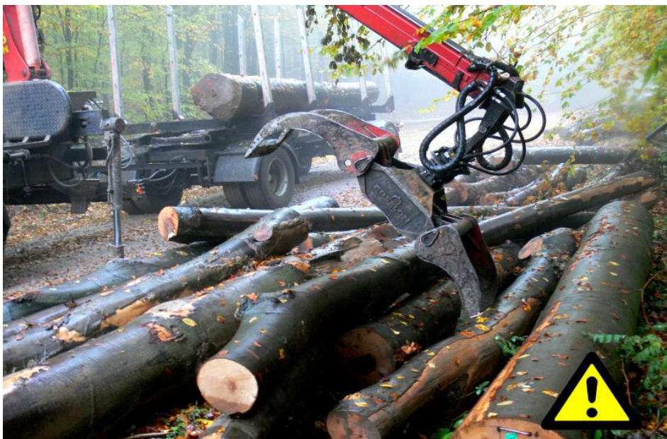
Slika 7. Izvlačenje sortimenata iz hrpe

Kod veće hrpe treba najprije utovariti one drvene sortimente koji nisu ukliješteni. Zabranjeno je izvlačenje drvnih sortimenata iz sredine hrpe.