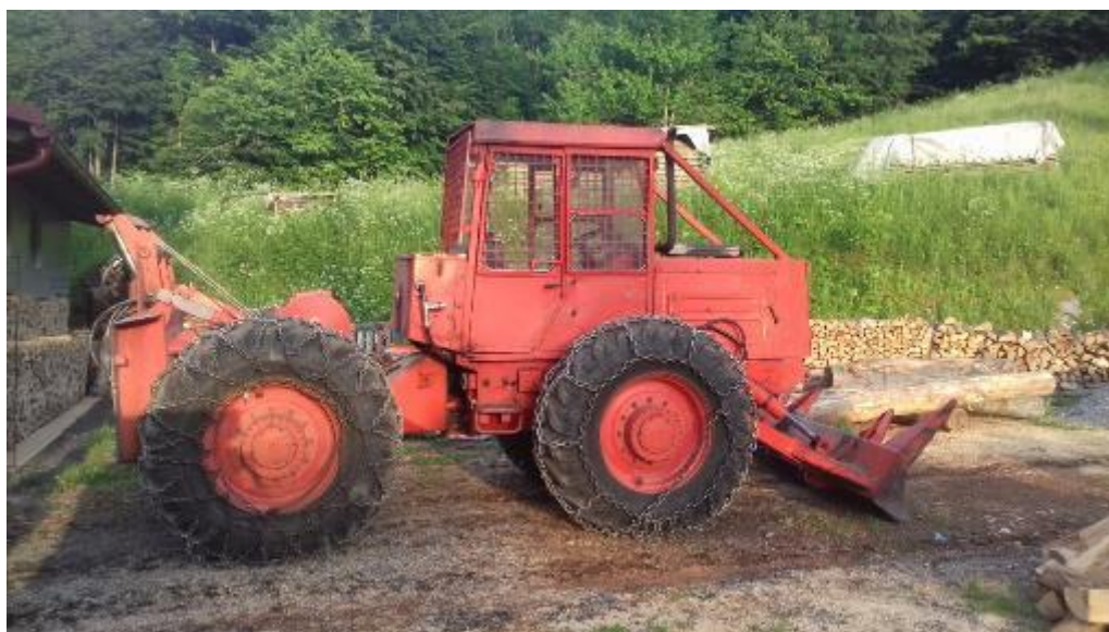
Slika 9. Sklopovi traktora