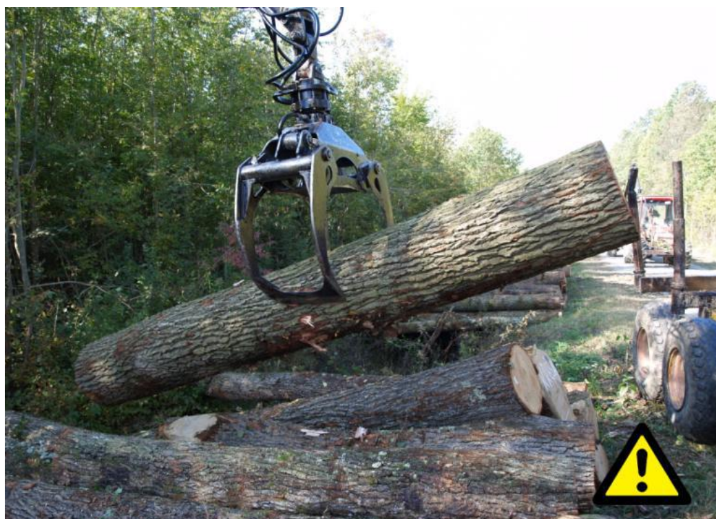
Slika 5. Neispravno obuhvaćen trupac