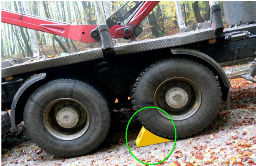
Slika 3. Osiguranje vozila

Na nizbrdici prije utovara ili istovara vozilo treba zakočiti i pod kotače postaviti klinastu podlošku.