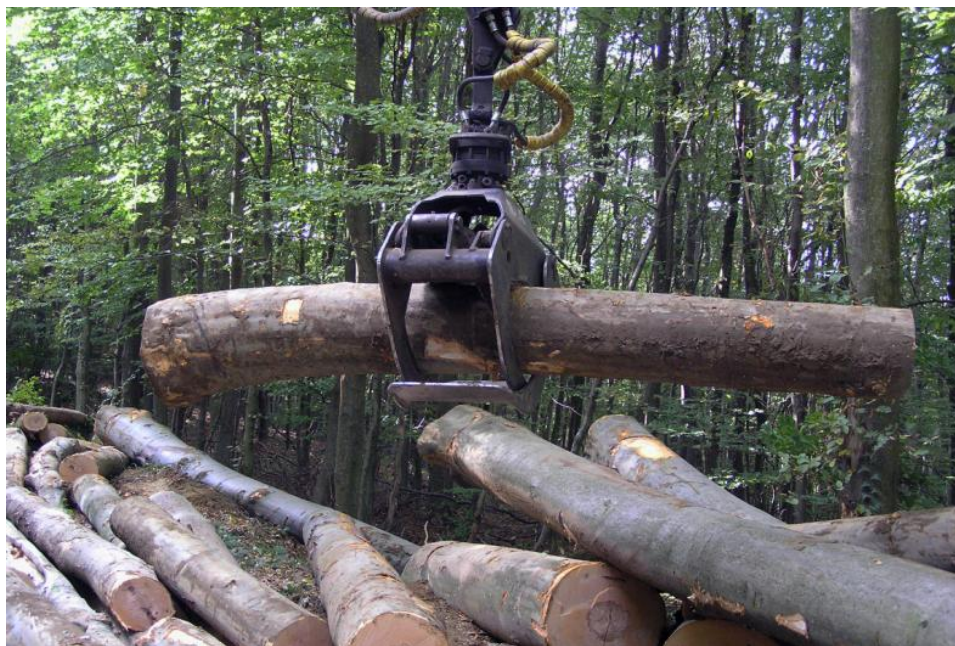
Slika 4. Ispravno obuhvaćen trupac