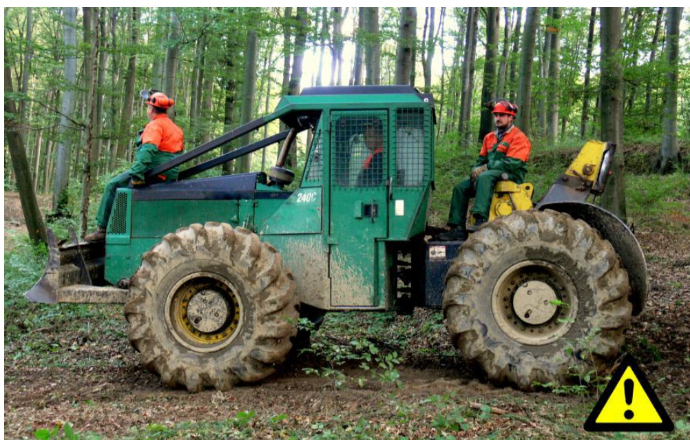
Slika 12. Zabranjeno prevoženje osoba

Ukoliko dođe do prevrtanja stroja potrebno se čvrsto uhvatiti za upravljač ili rukohvate u unutarnjem dijelu kabine, a nikako ne iskakati iz stroja. Za vrijeme vožnje treba koristiti zaštitnu kacigu i sigurnosni pojas (ukoliko je ugrađen). Kada je zemlja vlažna ili prekrivena lišćem potreban je poseban oprez jer lako može doći do klizanja stroja na strmom i nagnutom terenu. Na strmom i kliskom terenu na pogonskim kotačima stroja moraju biti postavljeni lanci koji će spriječiti klizanje. Prevoženje ljudi u ili sa strojem je zabranjeno, ukoliko stroj nije opremljen dodatnim sjedalima.