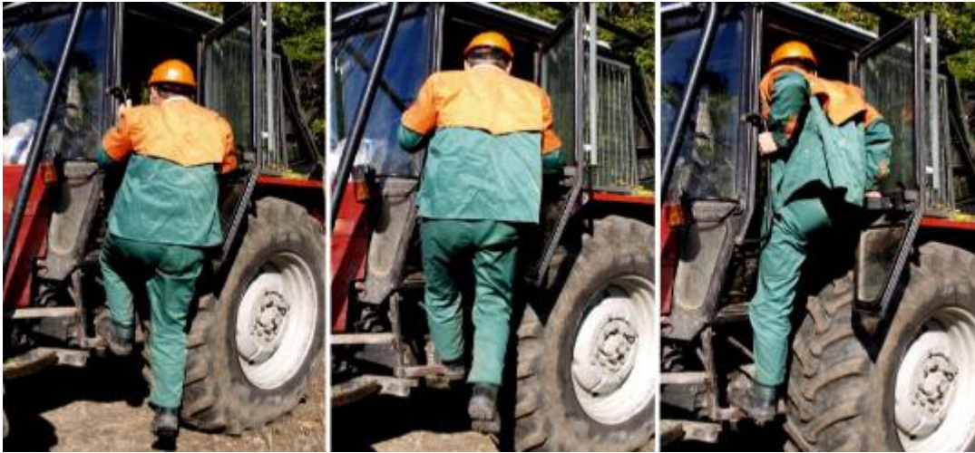
Slika 11. Nepravilan izlazak iz stroja