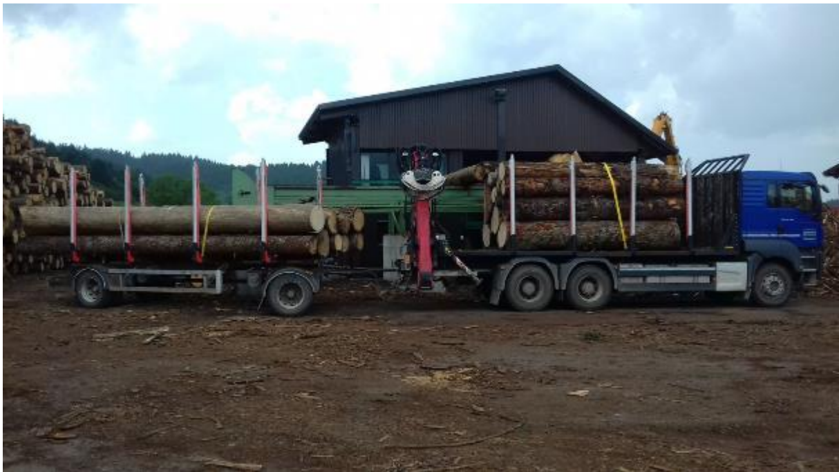
Slika 8. Dizalica u transportnom položaju

Složena roba mora odgovarati propisima u javnom prijevozu. Po završetku utovara treba pregledati dizalicu, prvenstveno spojeve cijevi i priključke. Stabilizatori trebaju biti podignuti i stavljani u položaj za transport, a hidraulična pumpa isključena. Ruka dizalice mora biti sklopljena u transportni položaj, a kliješta moraju pri vožnji biti tako učvršćena da se ne mogu osloboditi.