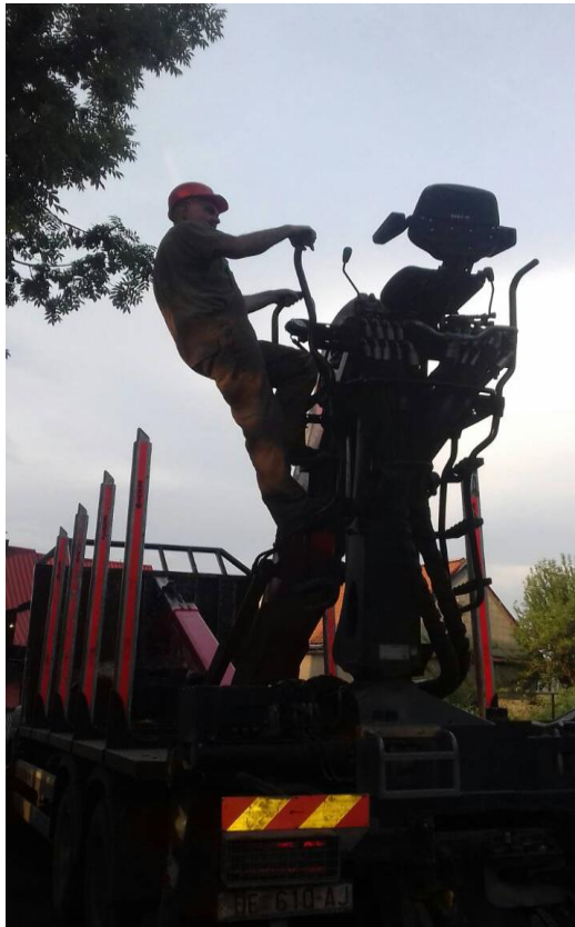
Slika 2. Pravilno penjanje na dizalicu