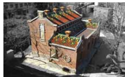
RESTAURACIÓ DEL PAVELLÓ DE STA. APOL·LÒNIA. HOSPITAL DE LA SANTA CREU I SANT PAU (BARCELONA)

Vicenç (s. XI-XII-XX) del castell de Cardona (2005-2008); la restauració del castell de Vacarisses (2005-2008), i la masia neoclàssica-modernista de can Ginestar (s. XIV-XIX-XX-2006-2008) van produir uns resultats que, no en va, van ser seleccionades (la masia de can Ginestar finalista) en la convocatòria dels premis editats pel COAC per la 2a trienal d'arquitectura i urbanisme del Baix Llobregat, l'Alt Penedès i el Garraf, edició 2008, així com dels Premis Catalunya Construcció de la 6a edició de l'any 2009 que va convocar el CAATEEB.