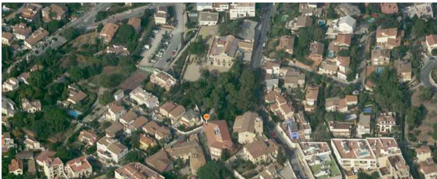
SANT JUST DESVERN ÉS UNA LOCALITAT MODERNISTA ON LES MASIES (AHIR RURALS, AVUI MÉS URBANES) COLONITZEN EL TERRITORI. CAN GINESTAR ÉS UN D'AQUESTS EMBLEMÀTICS EDIFICIS

canvis esdevenen un patrimoni que cal adaptar, no mistificar.