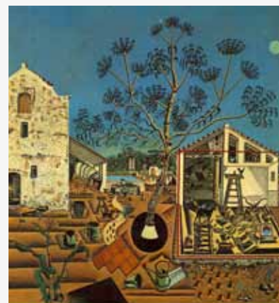
La Masia (1922), Joan Miró. National Gallery of Art, Washington.

Can Ginestar, que durant segles va ser una típica masia d'ús agrícola, està documentada des de la data que figura en una llinda de la planta baixa: 1403. Després, a l'interior, trobem la data de 1669, mentre que al primer pis n'hi ha una de 1703. L'edifici es corona amb la data de 1904. Serà aquesta darrera la que li confereix la imatge neoclàssica al conjunt, la que es posarà en valor en la intervenció que ens ocupa (de tota la resta, la majoria s'ha perdut). De la masia primitiva es manté, a part de la pròpia estructura de murs, el celler, la fresquera i dues sitges descobertes sota el rebedor. La masia té, per tant, una imatge neoclàssica. Així, el resultat de totes aquestes reformes va ser una mansió