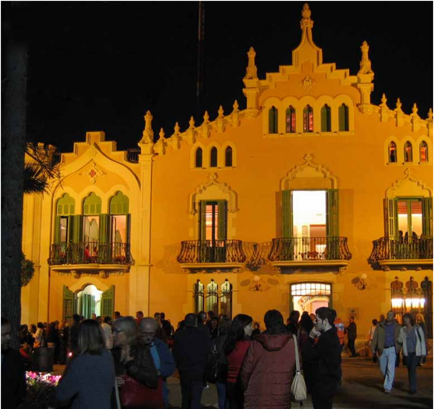
DE MASIA MIEVAL, PASSANT PER MASIA BARROCA I, FINALMENT, LA MASIA DE 1904, AVUI RECUPERADA