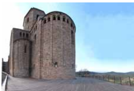
RESTAURACIÓ DEL CASTELL DE CARDONA