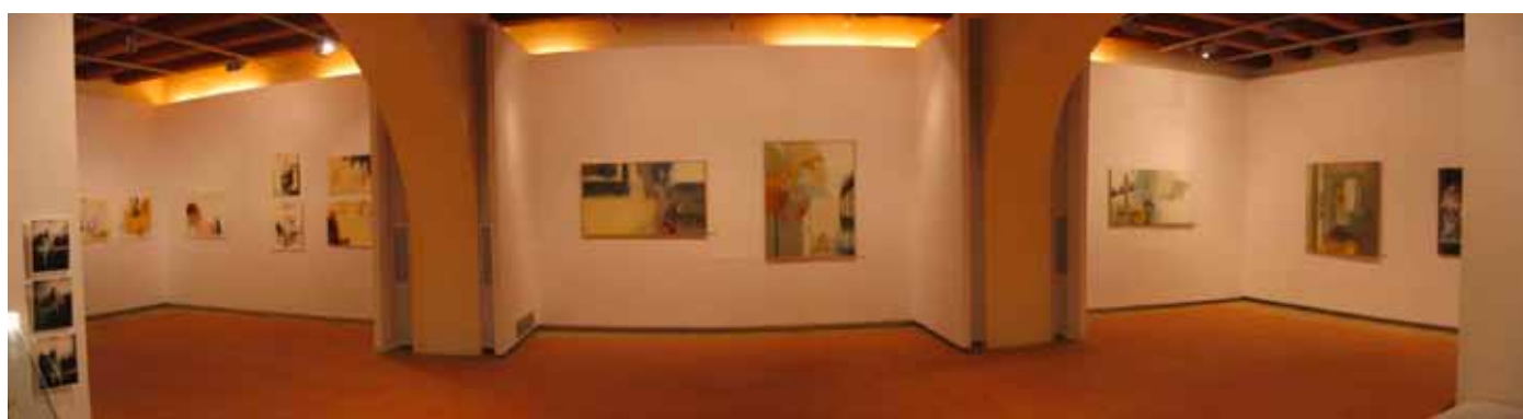
EL CELLER (PLANTA BAIXA, NAUS CENTRAL I LATERALS, SECTOR TRAMUNTANA)