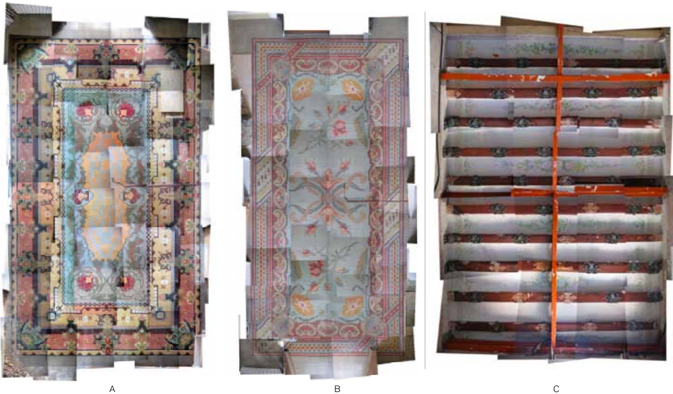
A B. COMPOSICIÓ FOTOGRÀFICA DEL PAVIMENT DE LES SALES CENTRALS DE TRAMUNTANA I MIGDIA DE LA PRIMERA PLANTA. C. COMPOSICIÓ FOTOGRÀFICA DEL SOSTRE DE LA SALA LATERAL DE LLEVANT DE LA PRIMERA PLANTA, SECTOR MIGDIA, DESCOBERT SOTA EL FALS SOSTRE DESMUNTAT