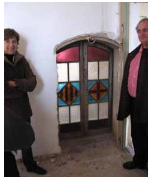
ELEMENTS ORNAMENTALS OCULTS

Certament, la complicitat, no exempta de tensions, la per-