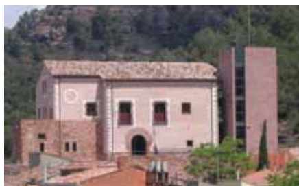
RESTAURACIÓ DE LA MASIA DEL CASTELL DE VACARISSES