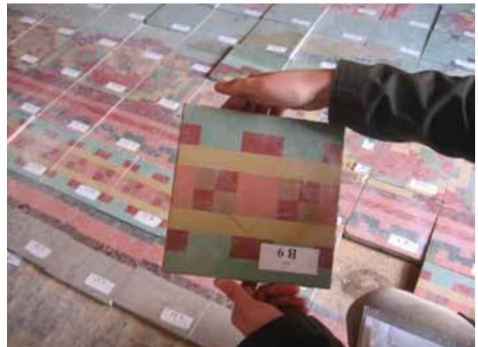
MOSTRA DE L'ASPECTE DE LES DUES CARES D'UNA PEÇA MALSOSA DURANT LA SEVA RETIRADA, AMB LA RESTAURACIÓ FETA

potser no caldrien per a edificis que ens donen informació clara del seu comportament en un llarg període de vida... edificis que tenim davant, que palpem... No és gaire lògic, no? No caldria primer analitzar quin és l'àmbit concret d'aplicació d'aquestes normatives? Per què és un delictes actuar en el patrimoni construït, en contra d'aquestes normatives? Bé, el que és