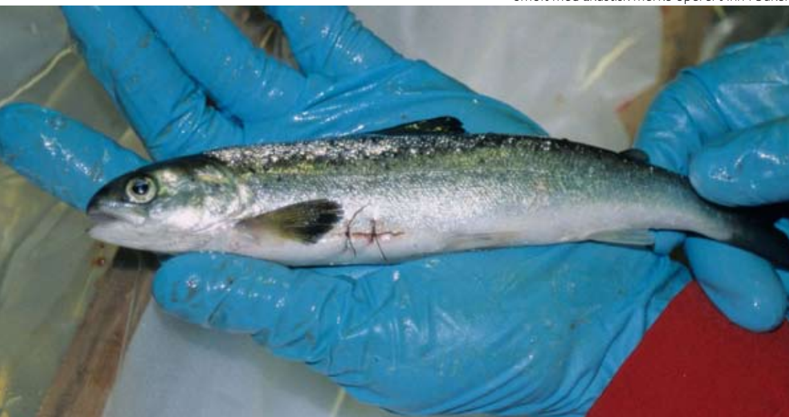
Smolt med akustisk merke operert inn i buken.

Vi overvåker fortsatt og venter at mer merket smolt vil komme fram til broen i løpet av sommeren. Selv om vi foreløpig ikke kan konkludere med hvor stor effekten kan være, synes det altså som om smolten sanser broen eller hydrografiske forhold den påvirker.