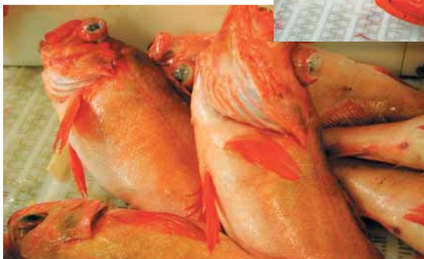
På vintertokt i Barentshavet.