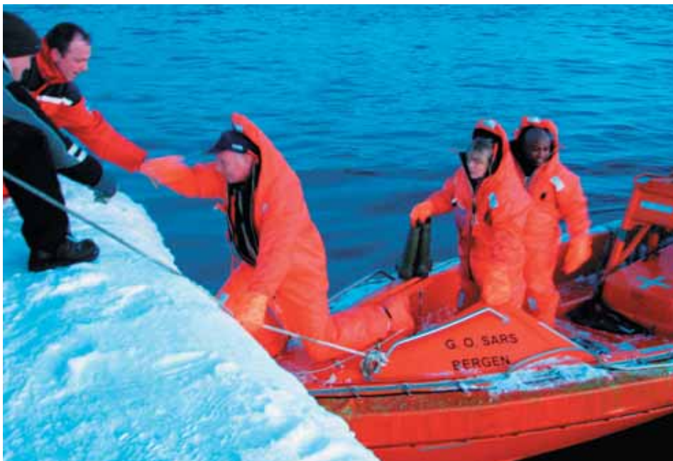
On shore at Bear Island during a survey in the Barents Sea.