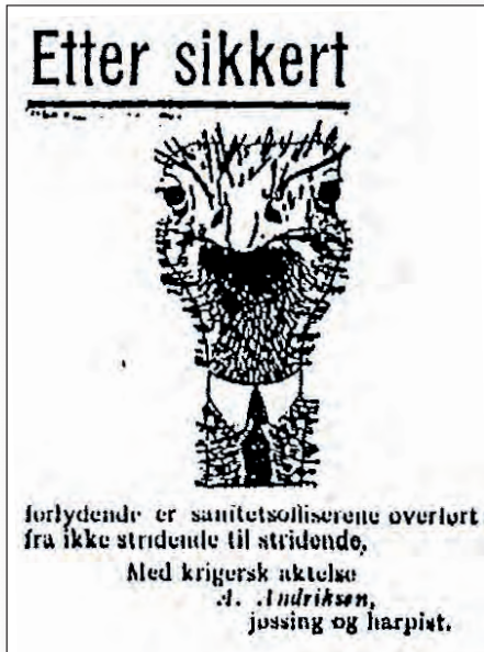
Figur 4: Vittighet i regjeringsorganet til forholdene i sanitetsledelsen under krigen.