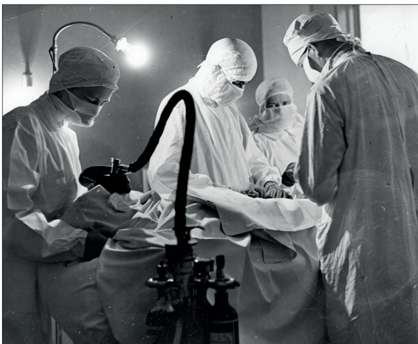
Figur 2: Fra det norske sykehus i London under Den annen verdenskrig.