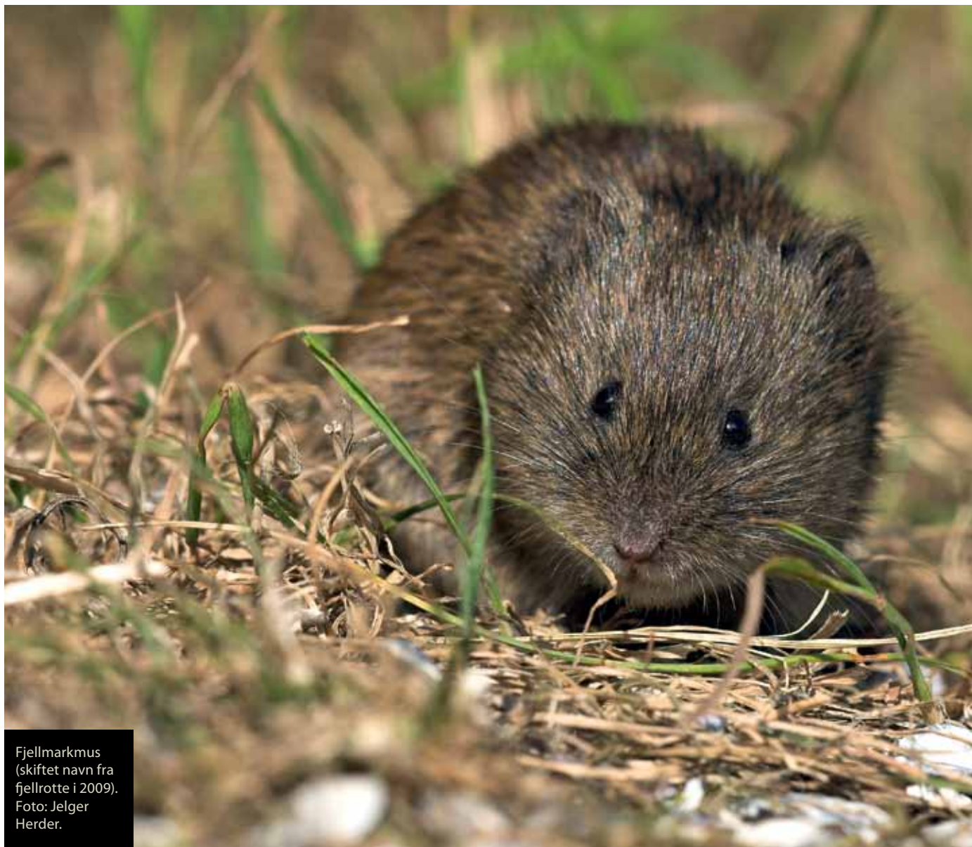
Fjellmarkmus (skiftet navn fra fjellrotte i 2009).