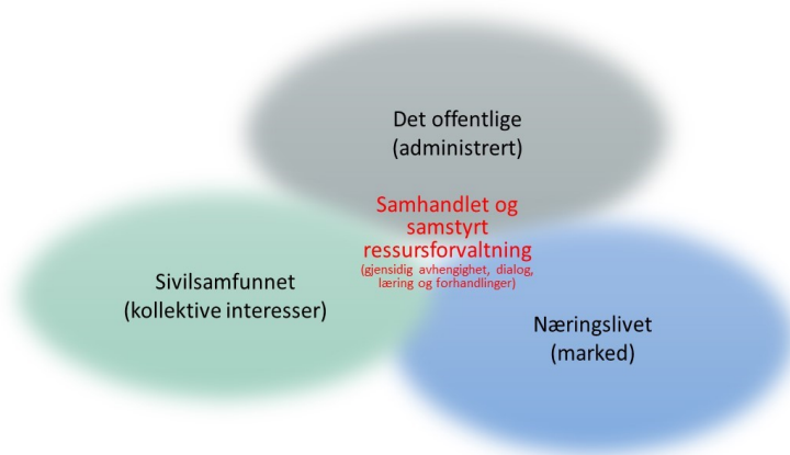
Figur 1: Tre prinsipielle ressursfordelingsmekanismer i

Det offentlige håndterer ressurser hvor man vil ha en administrativ kontroll på forvaltningen, næringslivet har en markedslogikk (verdibasert bytte) og sivilsamfunnet har en ressurslogikk ut fra ulike typer kollektive interesser. I dag ser vi at det er endringer i disse logikken ved at man synes å ha nådd kapasitetsgrense for administrert ressursfordeling og næringslivet