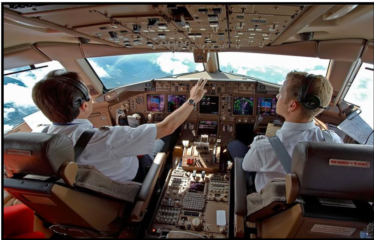
Bilde 4. Cockpitcrew.

Så kan man da spørre seg hvorfor er det ikke 2 sjåførere i vogntog og busser? Med buss mener jeg ikke lokalbusser, men busser som blir kjørt over lengre distanser, som for eksempel turbusser. Dette er farkoster som gjerne kan veie rundt 50 tonn (60 tonn for tømmerbiler), og blir betjent av en sjåfør, som skal være ansvarlig for lastsikring, kjøre og hviletider, tidspress samt selve kjøringen. Jeg er klar over at noen selskap praktiserer 2 sjåførere ved langkjøring, men generelt sett er det lite sjåførere å se på busser og vogntog. Hadde man hatt dette, ville den sjåføren som ikke kjører, fungert som en observatør som kunne fulgt med, og kommet med innsigelser og råd for selve kjøringen. Da hadde man vært 2 stykker som kunne diskutert trafikale forhold, føre og fartsavpasninger, både før og under kjøringen. Foretatt en risikoanalyse av de operative forhold man vil komme ut for. Vi snakker da om begrepet CRM, hvor «crewet» samarbeider om oppgavene, og hvor begge er klar over hva som gjøres, og hva som skal gjøres, og begge «er i loopen». De vil da også foreta det som er nevnt under begrepet TEM, hvor man hele tiden evaluerer de trusler man kjenner til, og de man kan forvente. Tar man da i tillegg med SOP, så vil alle retningslinjer for hvordan man skal kjøre og operere være nedfelt i disse, og man forholde seg til disse. I de fleste flyselskap forholder man seg strikt til disse, men går man utenfor SOP, må man informere den andre piloten, og han må være enig i at dette er ok.