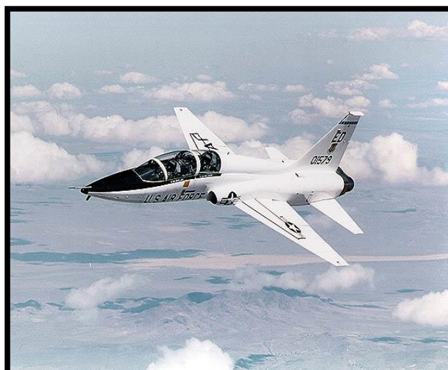
Bilde 2. T-38

Her er noen av de flytypene jeg har jobbet med.