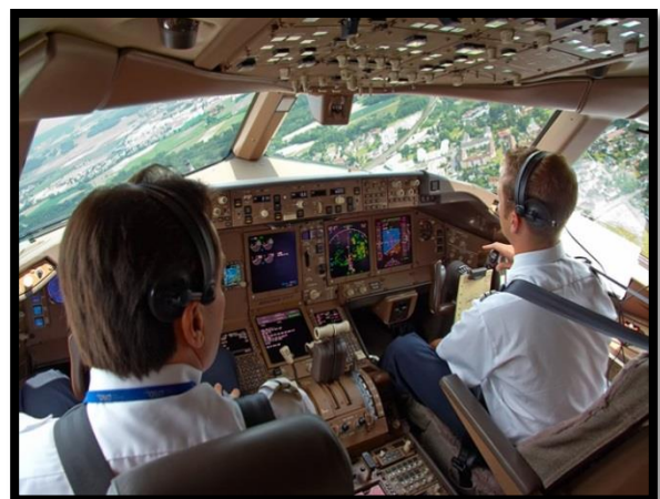
Bilde 6. Cockpitcrew.

Ser man på de 2 bildene ovenfor, så burde også buss - eller vogntogsjåføren hatt en ekstra sjåfør eller observatør ved sin side. Da ville man sannsynligvis også unngått juks med kjøre- og hviletidsbestemmelsene, som en del sannsynligvis bryter, samt at man hatt 2 stykker til å sjekke last, dekkmonster, teknisk stand osv., og utført CRM i henhold til selskapets regler.