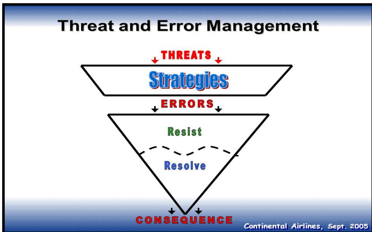
Figur 4. Threat and Error Management