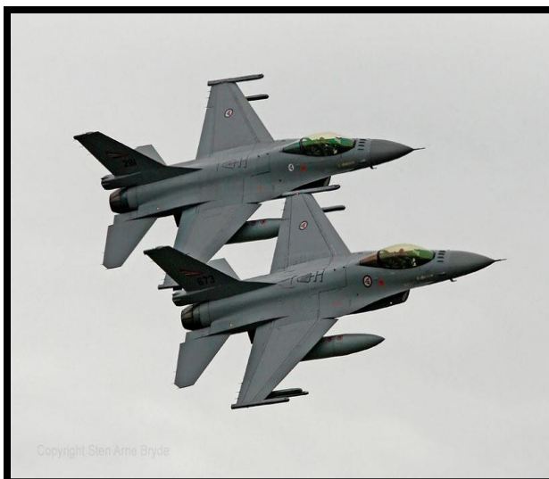
Bilde 1. F-16