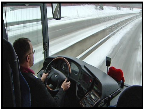
Bilde 5. Bussjåfør.

Hvorfor har man da ikke 2 sjåførere? Jeg tror dette handler om økonomi. Bransjen er presset på konkurranse og priser, og en ekstra sjåfør ville betydd en betydelig merkostnad. Et menneskeliv er anslått til å koste samfunnet ca. 30 millioner kroner (artikkel fra adressa.no), og medfører ufattelige tragedier. Jeg mener myndighetene skulle lagt til rette for avgiftslettelse for de selskap som hadde kjørt med 2 sjåførere. Tatt i betraktning de enorme kostnadene trafikkulykkene utgjør hvert år for samfunnet, ca. 28 milliarder (adressa.no), så kunne man nesten si på en snedig måte at det ville vært samfunnsbesparende å lønne en ekstra sjåfør på busser og vogntog.