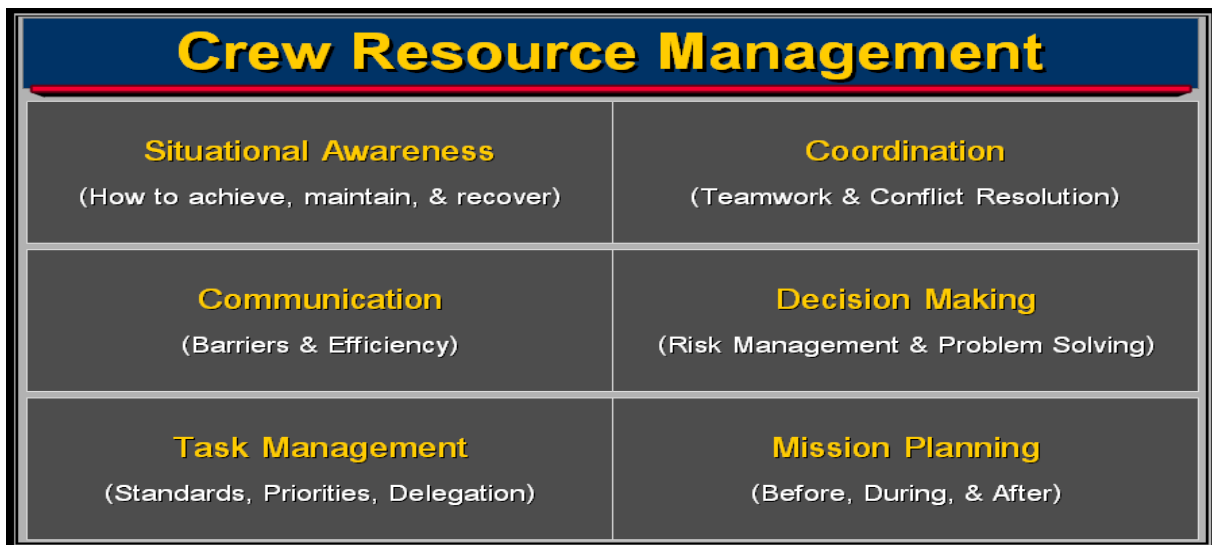
Figur 3. Crew Resource Management

går ut på å bruke de tilgjengelige ressurser, kunnskap og kommunikasjon for å forebygge uhell og stress i et crew samarbeid. Bakgrunnen for dette fokuset på CRM, var en rekke flyulykker på 1970 og 80-tallet, hvor man kunne fastslå at årsaken var mangel på kommunikasjon og samarbeid mellom crew-medlemmene, eller at kapteinen om bord var enerådende i en nødsituasjon, og tok alle beslutninger selv. Det viser seg at ca. 70-85 % av de senere års flyulykker skyldes menneskelig feil (Arbeidstid og HMS, Antony S. Wagstaff). Derfor ble det et voldsomt fokus på CRM-trening i flybransjen, noe man fortsatt har i dag.