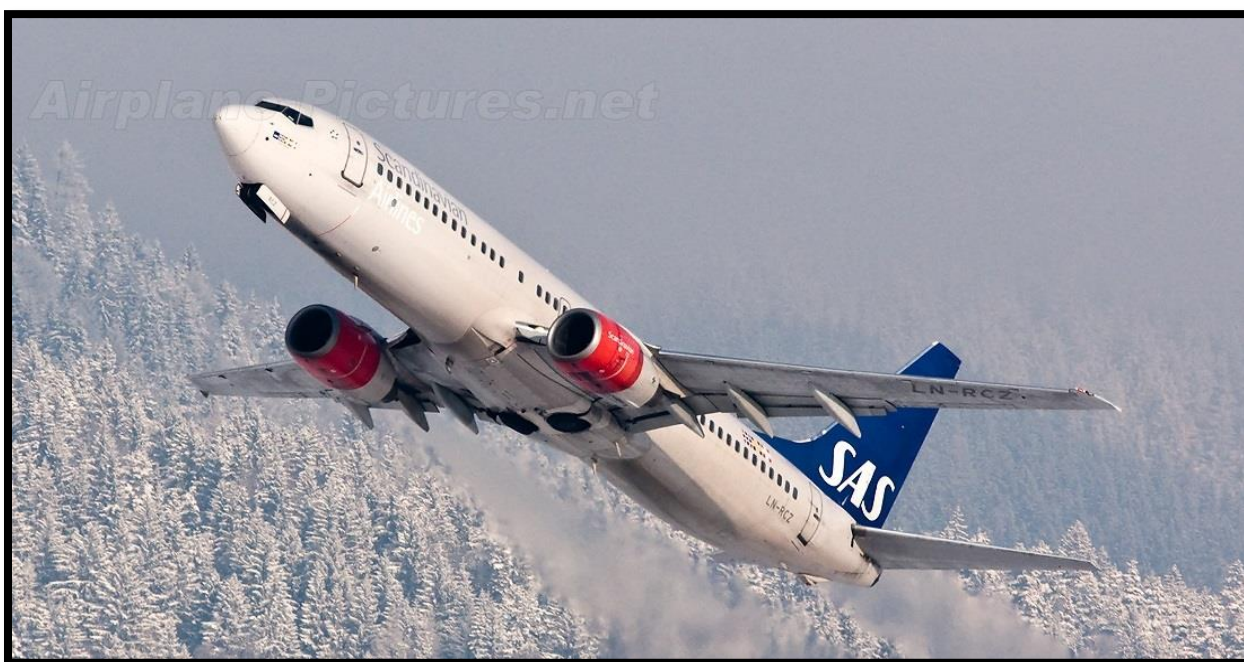
Bilde 3. Boeing 737.

Her er noen av de flytypene jeg har jobbet med.