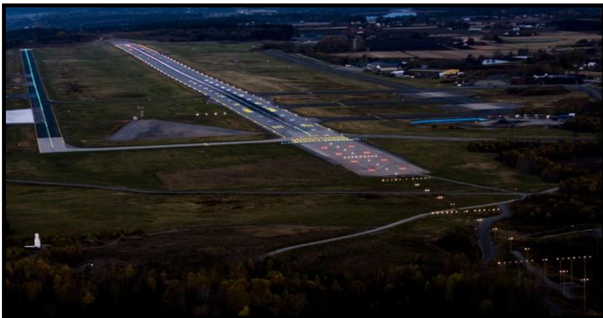
Bilde 7. Taxebane og rullebanelys.

Se på bildet over, og til venstre. Her ser man klart og tydelig en stripe i midten av taxebanen. Hvis vi tenker oss slike lys ved kritiske plasser som for eksempel uoversiktlige svinger, og ulykkes utsatte strekninger, hadde lys i midtlinjen i veibanen gjort førerne mer oppmerksom på senterlinjen i veien. Jeg ser også for meg at dette kunne vært brukt i 2-felts rundkjøringer. Vi kan se en del lys nå i moderne tunneller, som markeringer på siden av veien, som helt klart gir oss en begrensning sidevei om hvor veien slutter. Jeg ser for meg at dette kunne hatt noe for seg spesielt på riksveier, på høst og vinter. Hadde man da kommet kjørende og sett slike lys i veibanen, gjerne blinkende, tror jeg disse hadde fått oppmerksomhet, slik at man da hadde blitt mere skjerpet som sjåfør.