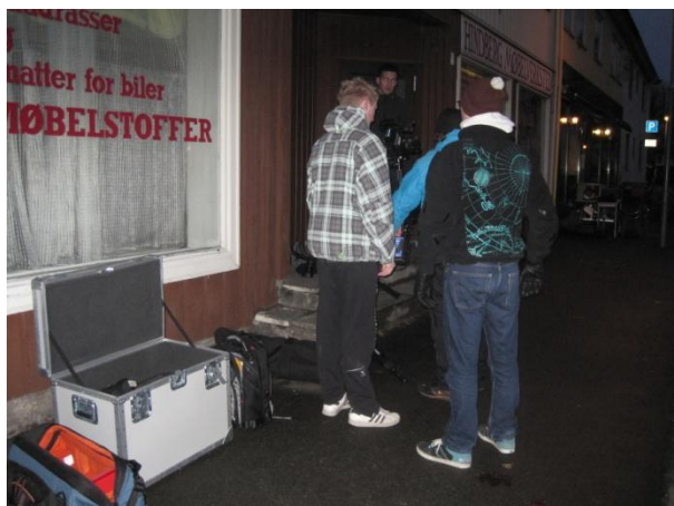
Oppmøte 08:00 i Steinkjer sentrum