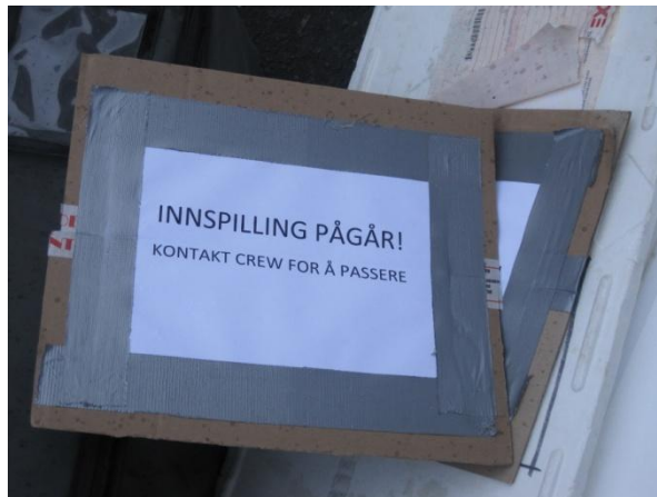
Hjemmelaget sperreskilt

Navn på deltagere under filminnspillingen, se vedlegg 1.