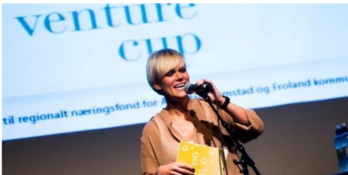
Sigrid Bonde Tusvik har deltatt på Start sine arrangementer tidligere og blir igjen å se på «Kick Off» i Trondheim. www.hint.no, 05.01. 2012

I fase 2 ble det i 2012 gjennomført to work-shops der deltagerne fikk tilgang på veiledere fra næringslivet og de fikk jobbe ene og alene med egen ide. Dette var en stor suksess og deltagerne følte at dette var rett måte å arbeide på i stedet for å legge opp til forelesing. Vi tror at dette er årsaken til at det ikke ble frafall av leveringer til fase 2 i 2012.