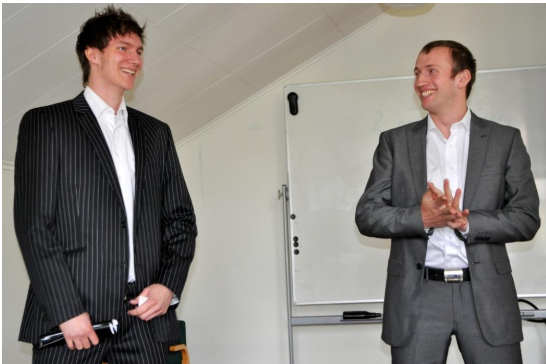
Best på HiNT 2012 - EasyCeiling SB.

Å delta på norgesmesterskapet i studentbedrifter er en flott erfaring for studentbedriftene. I 2011 deltok Gidd media SB. Den viktigste erfaringen var å oppleve nivået på studentbedriftene, og det var særlig kvaliteten på forretningsplanene som ga studentbedriften fra HiNT en tankevekker. I år deltok EasyCeiling SB. Studentene ga uttrykk for at dette var interessant og lærerikt. De ble utfordret på en del punkt, og lærte mye om det som må forbedres. Å konkurrere mot studentbedrifter på høyskoler som gir studiepoeng preget konkurransebildet.