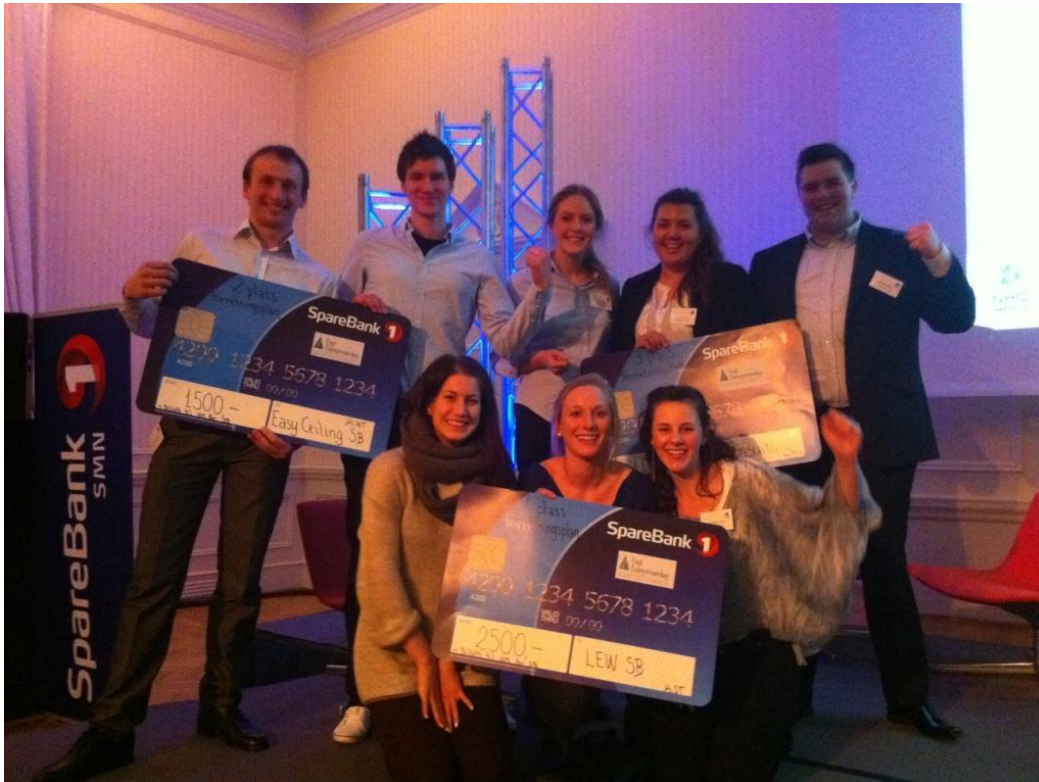
Trøndske mestere i SB 2012.

KPNT etter endte studier. I fjor valgte ingen av studentbedriftene denne muligheten. I år derimot er multimediebedriften Paranode SB i ferd med å etablere seg med kontorplass på kunnskapsparken som et AS. Dette viser en gryende trend som det skal bli interessant å følge videre. Forhåpentligvis vil enda flere studentbedrifter se denne muligheten, og med det bidra til at det blir flere vekstbedrifter blant unge i Nord-Trøndelag.