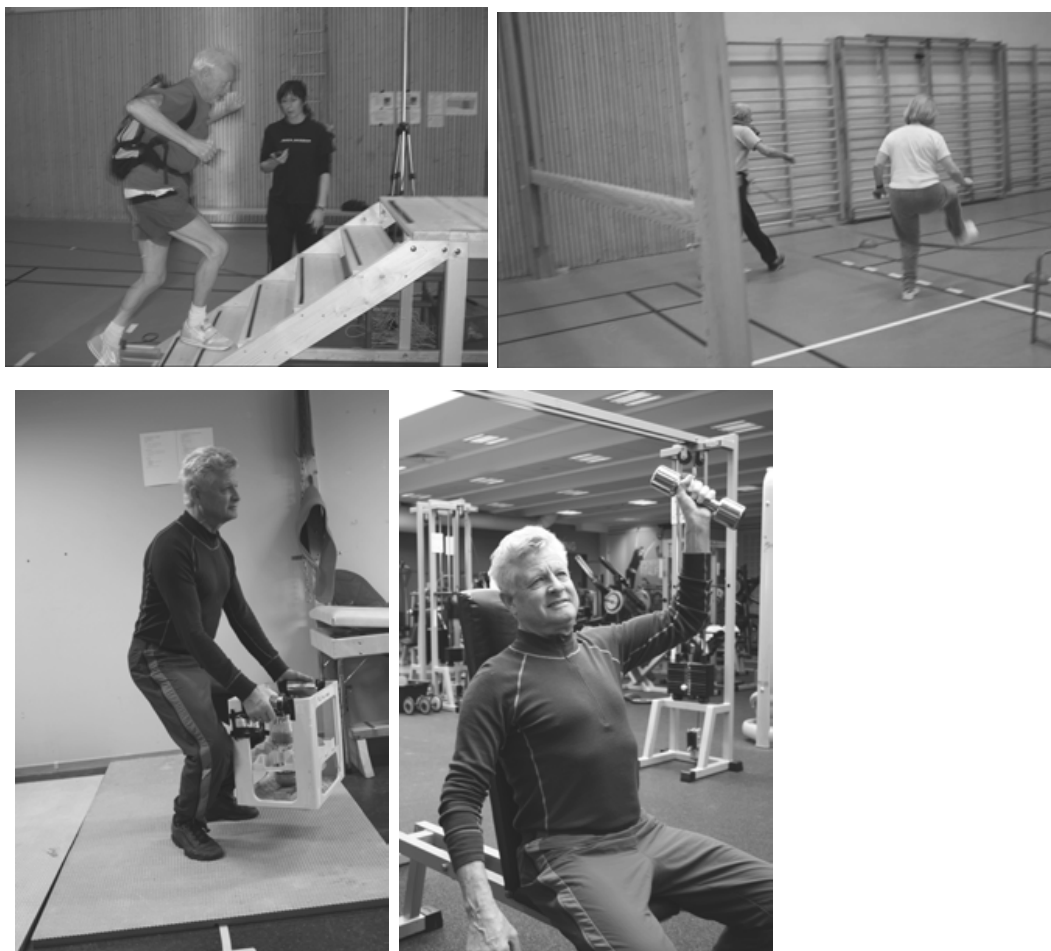
Figur 3. Funksjonell styrketrening (Lohne-Seiler et al., in press).

hydrat, og 10-20% protein (Helsedirektoratet, 2012). For eldre som trener regelmessig er det også av betydning å spise regelmessige måltider (helst hver 3.-4. time), samt ha fokus på å spise og drikke nok både før og etter trening.