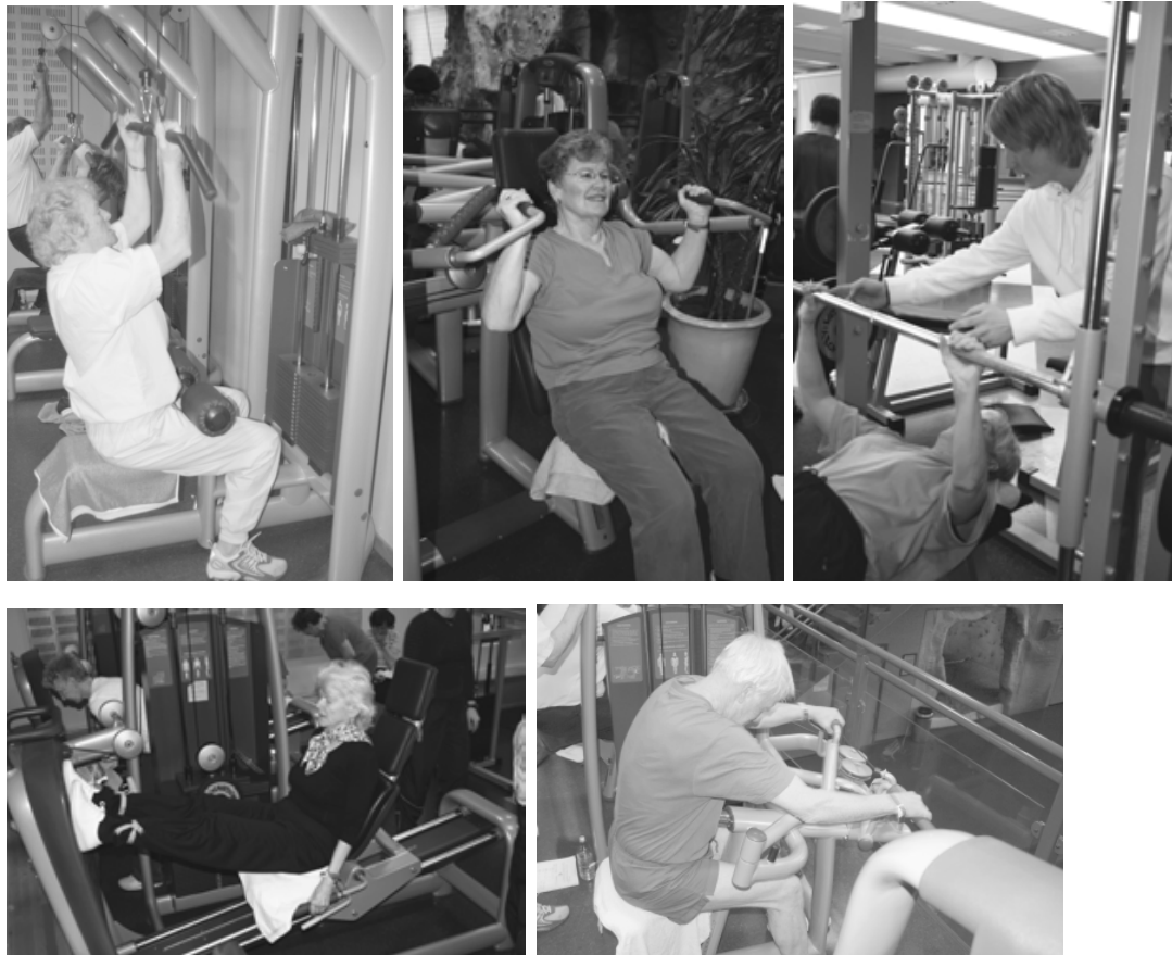
Figur 2. Styrketrening i faste apparater (Lohne-Seiler et al., in press).

kere! Det skal oppleves tungt og anstrengende. Allerede etter 8-12 uker er det mulig å øke muskelstyrken med opptil 10-20% hos eldre utrente individer (Reeves et al., 2003; Lohne-Seiler et al., in press). Videre er en økning av muskelens tverrsnitt (hypertrofi) på opptil 10% også dokumentert (Harridge et al., 1999; Patten & Kamen, 2000; Reeves et al., 2003). Ved hjelp av muskelbiopsier har det også vært mulig å vise til muskelvekst av både type I-fiber (langsomme og utholdende) og type II-fiber (raske), som følge av systematisk styrketrening (Frontera et al., 1988; Häkkinen et al., 2001; Schulte & Yarasheski, 2001). Trener man i faste apparater (se figur 2), er det enkelt å kontrollere for den belastningen man ønsker å påføre kroppen. Ved denne form for styrketrening jobber man isolert med en og en muskelgruppe. Fordelen her er at man har stor mulighet for å oppnå økt muskelmasse og muskelstyrke, så fremt belastningen er høy nok. Det er også trolig forbundet mindre risiko for skade ved denne type styrketrening.