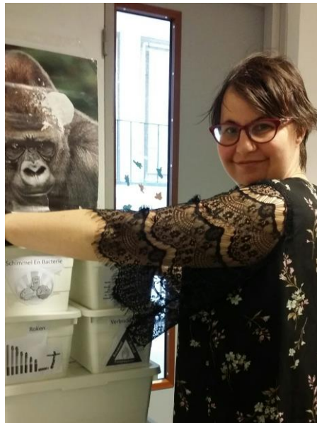
Pascalle Stanislascollege Rijswijk