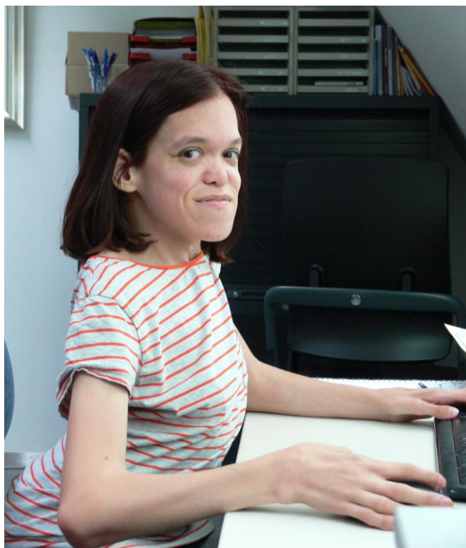
Judith Regius College Schagen