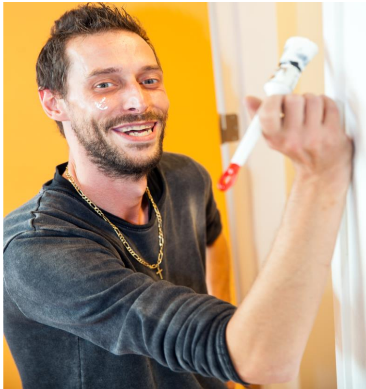
Sander 's Gravendreef College