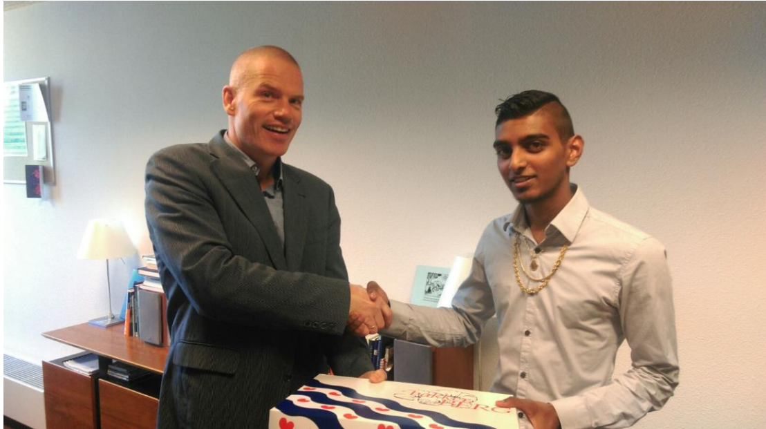
Krishen Comenius Zamenhof