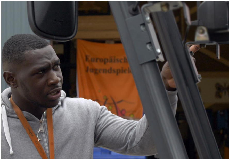
Odilly Almeerse Scholen Groep