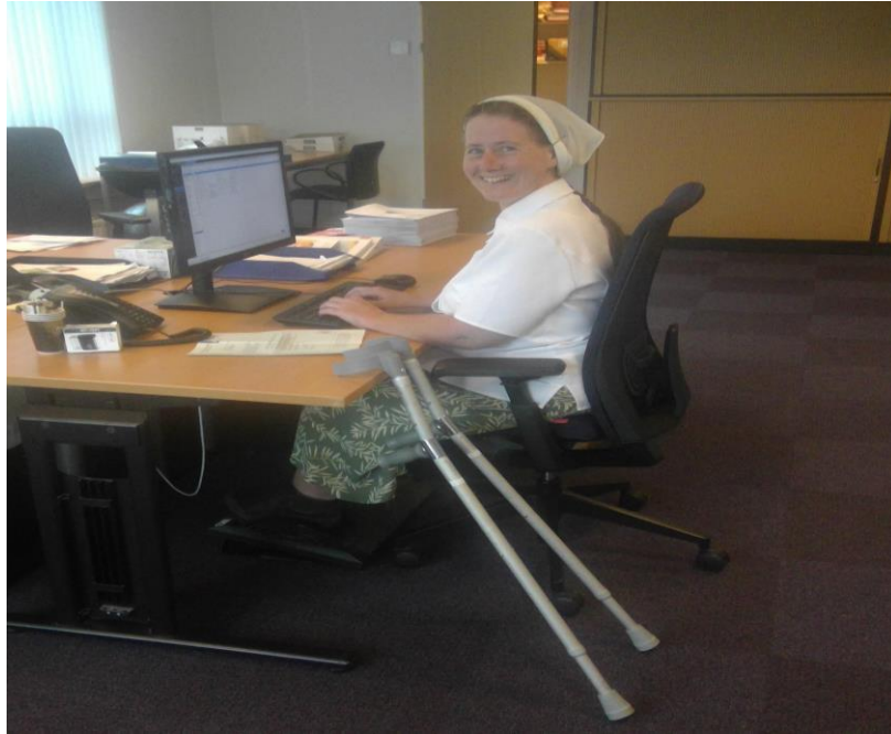
Nellie Wartburg College