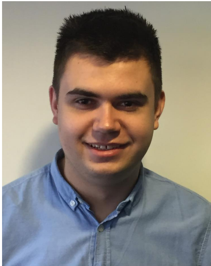
Nathan Christelijk Lyceum Delft