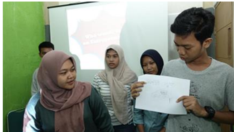
Gambar 4 Presentasi Rencana Usaha

Setelah diberikan materi dasar mengenai kewirausahaan, peserta secara berkelompok diminta untuk membuat sebuah proposal usaha. Mereka dituntut untuk berpikir kreatif dan inovatif. Peserta diajarkan langkah-langkah untuk membuat suatu usaha. Langkah pertama adalah menemukan masalah. Masalah ini bisa berada di sekitar mereka ataupun mengacu pada tujuh belas tujuan pembangunan berkelanjutan ( 17 Sustainable Development Goals ) dari PBB yang dipetakan pada gambar 5.