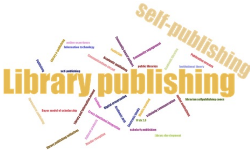
FIGURA 5 Nube de etiquetas de las palabras clave de los trabajos analizados en la SLR Elaboración propia.

Sólo un 10% de esas palabras clave hace alusión expresa a términos relacionados con el mundo digital y las nuevas tecnologías, un porcentaje muy bajo ya que los trabajos sí analizan mayoritariamente esos contextos. Quizás sea un indicativo de que este panorama (digital) empieza a ser considerado el estado habitual, y por tanto no necesita referencias ni alusiones específicas.