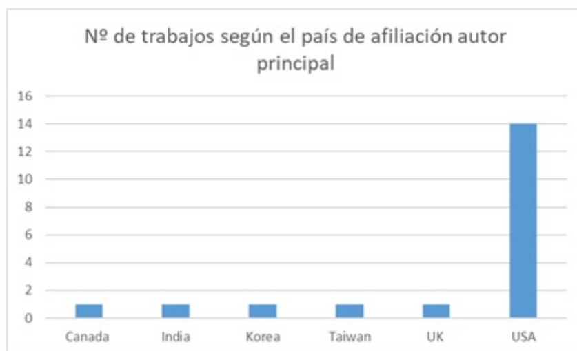
FIGURA 2 Cantidad de trabajos por país de afiliación del autor principal Elaboración propia

Este sesgo geográfico va acompañado de un claro sesgo anglosajón a nivel idiomático y temático, puesto que una gran cantidad de los trabajos analizan casos concretos de bibliotecas anglosajonas. Para descartar que el sesgo pudiera estar producido por los términos de la cadena de búsqueda (en inglés), se repitió la misma búsqueda añadiendo los términos en español, y se pudo comprobar que el idioma añadido no aportaba ningún trabajo nuevo en los resultados.