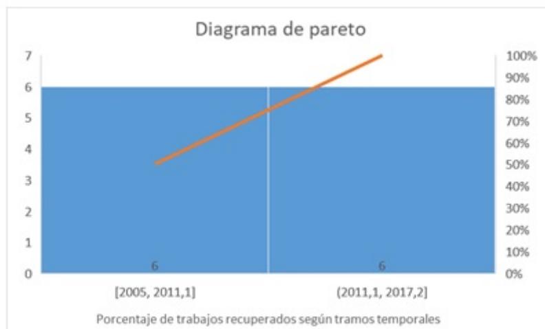
FIGURA 4 Diagrama de pareto mostrando la distribución de los trabajos en orden descendente de frecuencia en relación con el porcentaje del total mostrado en la línea acumulativa del eje secundario Elaboración propia

Otro detalle destacable es la notoria ausencia de palabras clave, siendo que sólo el 50% de los trabajos tienen asignadas palabras clave. Tanto si la ausencia depende de la base de datos, como si depende de la revista, se trata de una práctica poco recomendable, ya que perjudica a la visibilidad y recuperación de los artículos (Mangas-Vega, Dantas, Gómez-Díaz, y Merchán Sánchez-Jara, 2017).