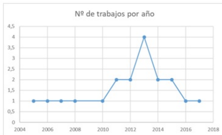
FIGURA 3 Gráfico de dispersión de la cantidad de trabajos recuperados en la revisión en relación con su año de publicación Elaboración propia.