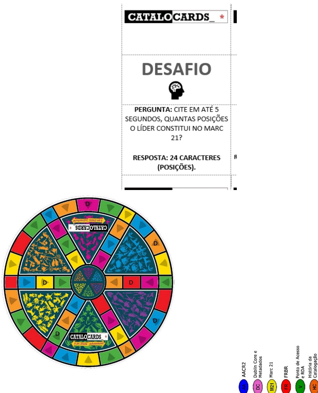
Figura 3- Exemplo de carta “Desafio” e design do tabuleiro

As cartas gerais contêm as perguntas e resposta no mesmo cartão (Figura 4). O jogo pode ser jogado por no mínimo 2 e no máximo 6 participantes, e tem um tempo médio por partida de 90