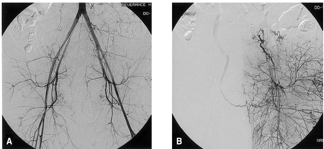
Fig. 1. (A) Digital subtraction angiography (DSA) with pelvic hypervascularity before embolization, (B) Increased vascularity of distal branches of left uterine artery is noted.

선택적 자궁 동맥 색전술 시행 후 질출혈양은 현저히 감소하였으며 활력징후는 혈압 100/60 mmHg, 맥박 94 회/분으로 안정되었다. 총 5 unit의 농축적혈구를 수혈하였고 수혈 후 혈색소 수치는 8.5 g/dL, 적혈구 용적 25.5%, 백혈구 19,000/mm 3 , 혈소판 130,000/mm 3 였다. 감염에 대한 예방적 항생제로 Cefminox sodium 2.0 g 및 Isepamicin sulfate 400 mg을 12시간 간격으로, Metronidazole 1.5 g을 8시간 간격으로 정맥주사 하였다. Oxytocin 20 unit를 하루 동안 정맥주사 하였고 misoprostol 1000 mg을 2시간 간격으로 항문 삽입하였으며 수술 후 1일째 질출혈은 패드 1장 정도로 소량하였고 혈색소 수치는 8.1 g/dL으로 추가적으로 2 unit의 농축적혈구를 수혈하였다. 수술 후 3일째 혈색소 수치는 10.3 g/dL이었으며 질출혈은 패드에 묻는 정도로 소량이었다. 혈중 βHCG 수치는 600 mIU/mL이었고 질식초음파 검사상 유착태반으로 의심되는 8×7×7 cm 3 크기의 잔류태반이 자궁 후부에 관찰되