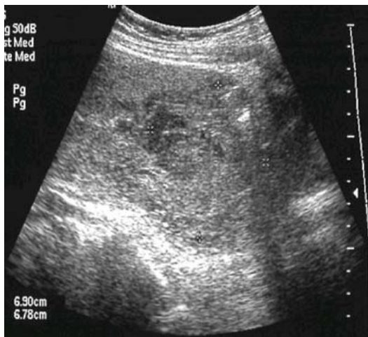
Fig. 3. Transvaginal ultrasonogram showing placenta accreta before treatment.