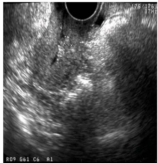
Fig. 4. Transvaginal ultrasonogram showing placental tissue much decreased in size to less than 1 \times 1 \text{ cm}^2 at 10 weeks following uterine artery embolization and methotrexate.

었다 (Fig. 3). 환자 및 보호자가 생식력 보존을 위하여 methotrexate를 이용한 보존적 치료를 시행하기로 하고 이에 대한 위험성 및 발생 가능한 합병증에 대해 설명 후 선택적 자궁 동맥 색전술 시행 후 7일째부터 methotrexate (1 mg/kg/day)와 leukovorin (0.1 mg/kg/day)를 8일 동안 격일간격으로 근주하였고 이때부터 경구용 항생제와 비스테로이드성 소염진통제를 투여했으며 methylergometrine maleate 500 \mu\text{g} 을 6시간 간격으로 경구 투여하였다. Methotrexate 치료 8일째 시행한 질식 초음