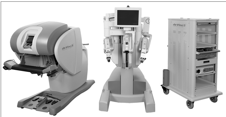
Fig. 1. da Vinci S Surgical system.

수술이 로봇을 이용하여 시행되었다. 4명의 술자가 605례를 수술하였으며, 나머지 3명의 술자는 모두 6례만을 수술하였다. 2007년 5월까지의 모든 수술을 1대의 da Vinci Robot으로 하였으며, 그 이후부터 현재까지는 개량형인 da Vinci S (Fig. 1)로 시행하였다. 환자의 평균 나이는 59.1±11.2세였으며, 남자가 576명 (94.3%)이었다. 수술의 종류는 근치적 전립선적출술이 544례, 부분신절제술이 35례, 근치적 신요관적출술이 13례, 근치적 방광적출술이 10례, 근치적 신적출술이 10례, 부분 방광절제술이 1례였다. 환자의