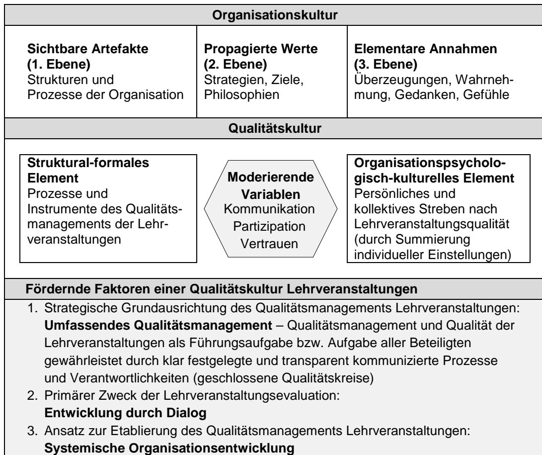
Abbildung 1: Qualitätskultur eingebettet in die Organisationskultur (i.A. EUA, 2005; 2006; 2010; Meyer Richli, 2015; 2016; 2017; 2018; Schein, 2010)