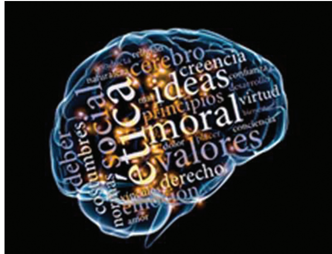
“El cerebro ético”, de Adolfo Castilla. Fuente: Revista Economía y Futuro , 11 de octubre 2013.

Los valores profesionales del docente se definen y estructuran a través de su práctica profesional; es decir, al realizar la enseñanza y el conjunto de actividades educativas que actualmente se han asignado al docente. Sin embargo, la función principal que tiene el profesor es la enseñanza, porque es la actividad que constituye el corazón de su identidad; es la actividad sustantiva de la docencia y la función social que ha sido aceptada y reconocida por la sociedad.