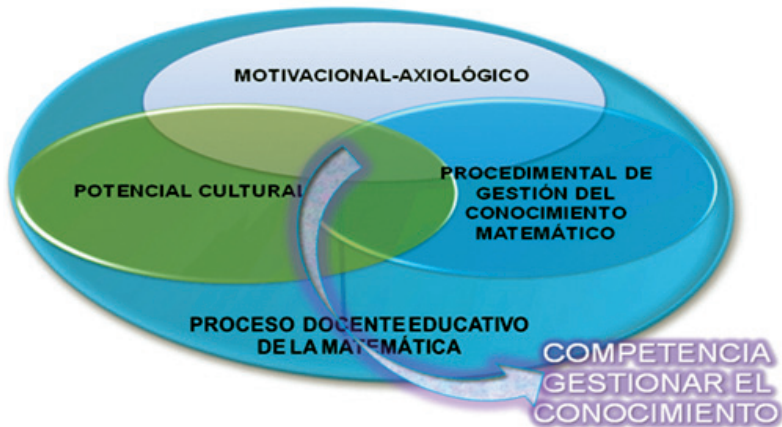
Figura 1. Representación gráfica del modelo para la formación y desarrollo de la competencia para gestionar el conocimiento matemático.