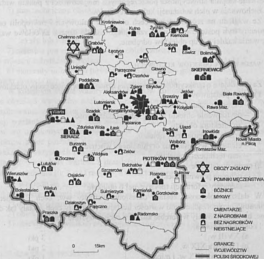
Rys. 2. Obiekty kultury materialnej i martyrologii Żydów na obszarze Polski Środkowej – mapa inwentaryzacyjna (opracowanie własne)

ktę. Cmentarze Polski Środkowej stanowią ogółem 6,2% wszystkich nekropolii żydowskich w Polsce (2,9% – kategoria A, 2,2% – kategoria B, 1,1% – kategoria C). Rozmieszczenie obiektów kultury materialnej Żydów na obszarze Polski Środkowej przedstawia rys. 2.