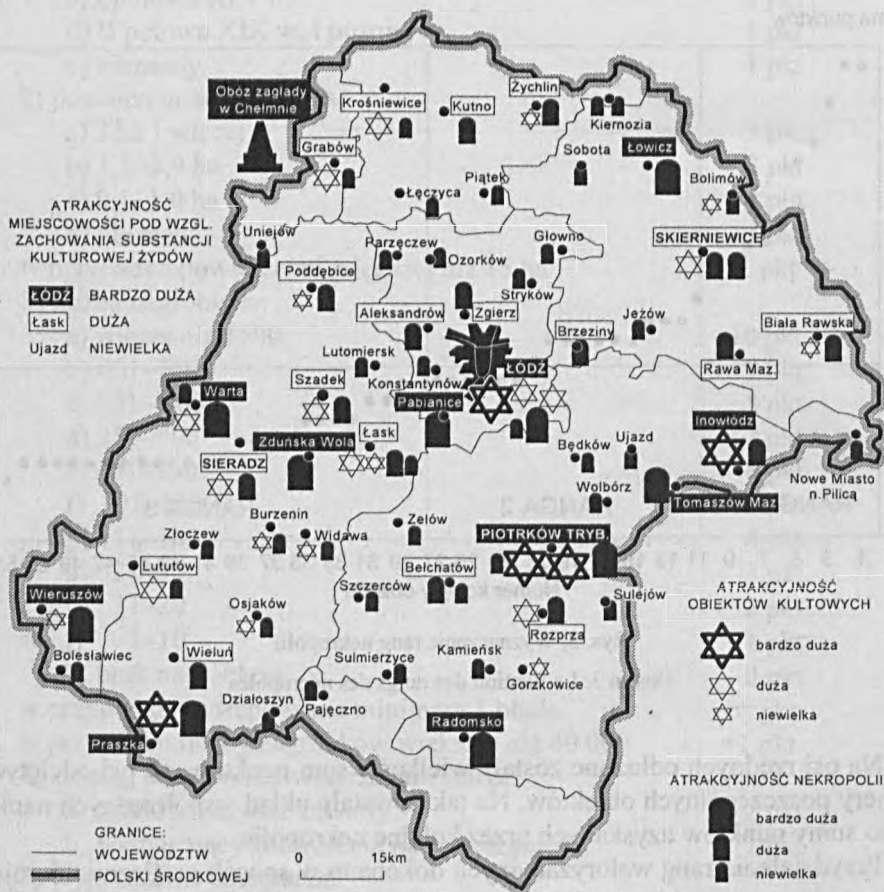
Rys. 4. Walory krajoznawcze miejscowości związane z kulturą żydowską na obszarze Polski Środkowej (opracowanie własne)

W podsumowaniu waloryzacji nekropolii należy wyraźnie podkreślić, że została ona przeprowadzona przez geografa wyłącznie pod kątem przydatności obiektów dla potencjalnego turysty. Pominięte zostały wszystkie niewymierne aspekty związane z uczuciowym podejściem do nekropolii.