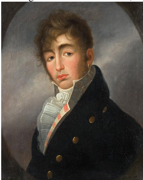
II. 3. Portret x. Dominika Radziwiłła, I ćwierć XIX w.

Honorowej, Krzyż Virtuti Militari (il. 5). Autentyczność uwiecznionych na płótnie nagród potwierdzają fakty biograficzne 62 . Pierwszy z wyżej wymienionych – Order św. Huberta – ustanowiono w 1444 roku 63 . Na mocy późniejszych ustaleń nadawano go wyłącznie osobom posiadającym tytuł książęcy lub należącymi do elity szlacheckiej. Ordynat nieświeski był jednym z 55 Polaków uhonorowanych na przestrzeni XVIII i XIX stulecia, obok m. in. Józefa Aleksandra i Stanisława Wincentego Jabłonowskich, Antoniego i Józefa Lubomirskich, czy Franciszka Ksawerego Sapiehy 64 .