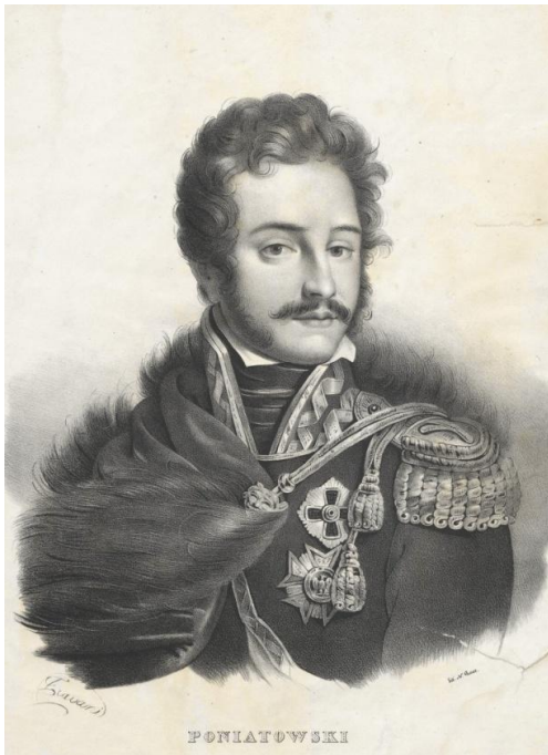
Il. 6. N. Grace, Portret księcia Józefa Poniatowskiego, ok. 1820 (Muzeum Narodowe w Warszawie)