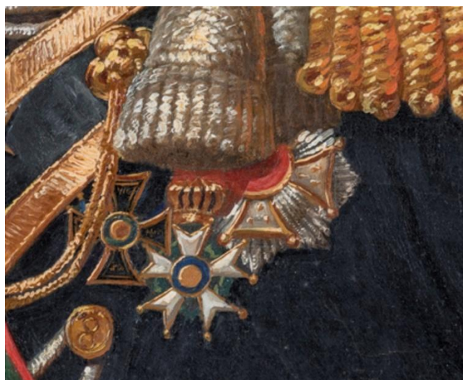
Il. 5. Od lewej: Krzyż Virtuti Militari, Order Legii Honorowej i Order św. Huberta, Portret Dominika Hieronima Radziwiłła – detal, (Schillingsfürst,)

muzeum w Nowogrodzie. Widoczny na portrecie strój oraz sama odznaka, stanowiąca manifestację poglądów antyrosyjskich, zostały dodane wtórnie – jak wykazały tegoroczne badania rentgenowskie pierwotnie Radziwiłł odziany był w masoński fartuch. Symbolikę wolnomularską potęgowała obecność tzw. «Klucza Wszechwiedzy» i «Płomiennej Gwiazdy», spoczywającego w dłoni berła bądź miecza oraz kolumny, która stanowiła tło dla sceny. Zdaniem części badaczy zmian dokonano już po śmierci ordynata 68 .