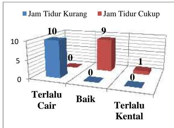
Gambar 3 Grafik Hemoglobin

Berikut ini hasil pengukuran kadar hemoglobin pada sampel saat memiliki jam tidur kurang dan cukup di Fakultas Ilmu Keolahragaan Universitas Negeri Makassar.