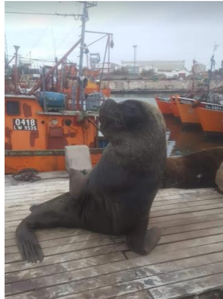
Imagen 9. Fotografía Puerto de Mar del Plata