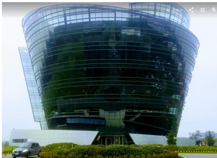
Imagen 5. Fotografía Zona América Montevideo Uruguay