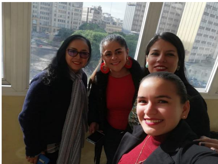
Imagen 1. Fotografía UBA Buenos Aires Argentina