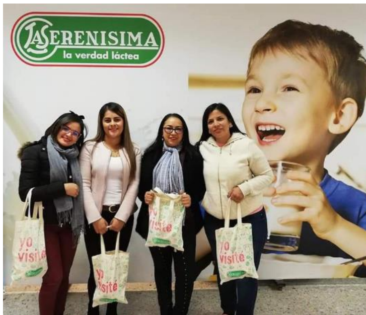
Imagen 7. Fotografía La Serenísima, Buenos Aires Argentina.