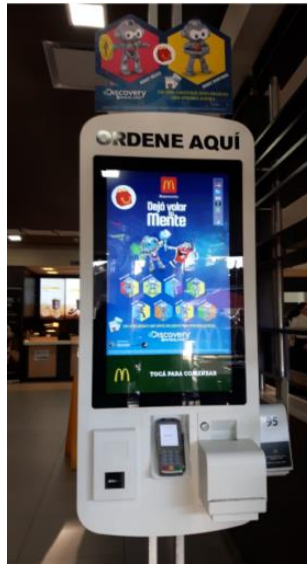
Imagen 8. Fotografía Logo McDonald's