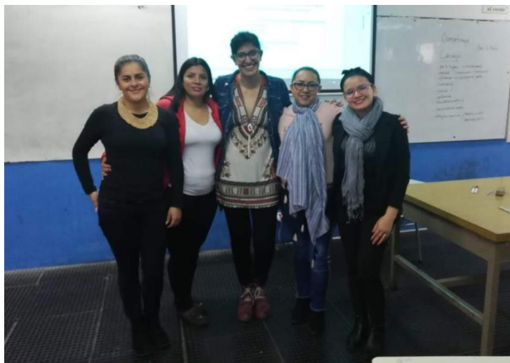
Imagen 3. Fotografía Taller de liderazgo, Universidad de Mar del Plata Argentina