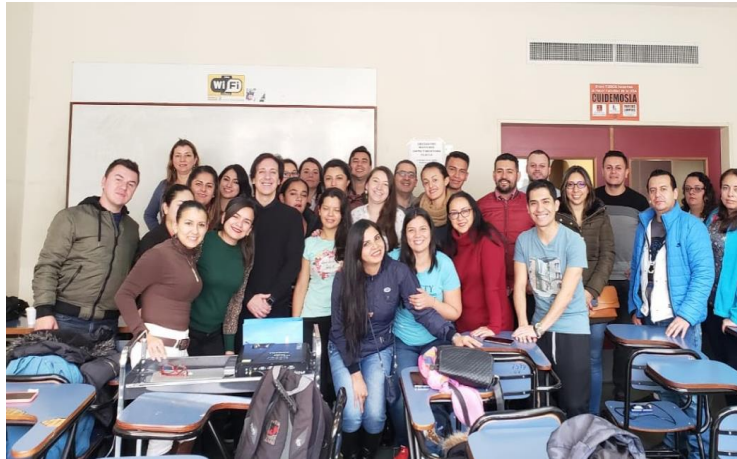
Imagen 2. Fotografía Taller Habilidades Gerenciales, Universidad de Buenos Aires Argentina