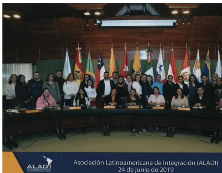
Imagen 6. Fotografía Asociación Latinoamericana de Integración (ALADI) Montevideo