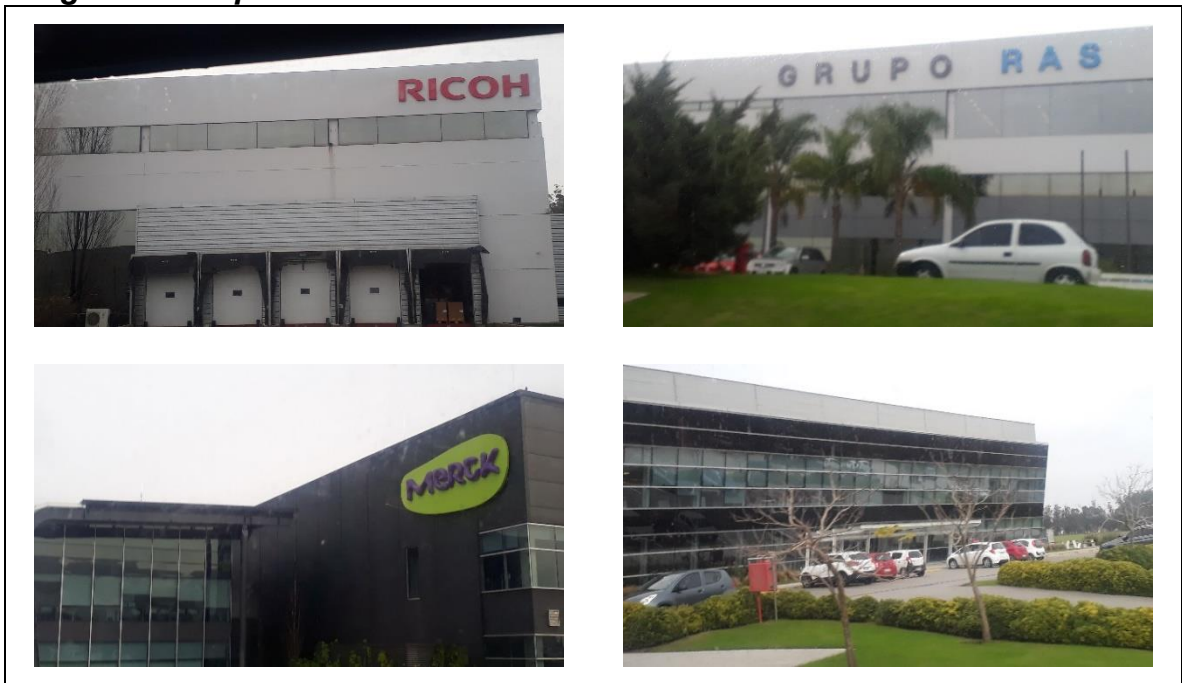
Imagen 3: Compañías ubicadas en Zona Américas

Continuando con un proceso de internacionalización, viene desarrollando desde el año 2016 la construcción de un complejo empresarial de similares características en Colombia, específicamente en el sur de la ciudad de Cali, el cual contara con la construcción de 18 edificios de última generación, enfocado a captar empresas que se dediquen a procesos de servicios globales.