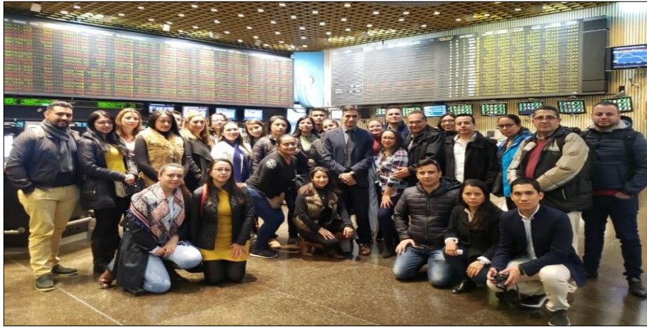
Imagen 8: Sede Bolsa de Buenos Aires

La bolsa de valores de Argentina es un icono para latinoamérica por su tradición y experiencia sobre todo en periodos anteriores siendo la más importante en su época por lo cual esta entidad cuenta con la experiencia suficiente para el manejo de estos mercados.