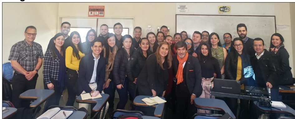
Imagen 1: Universidad de Buenos Aires

En conclusión, la calidad de un producto es una consecuencia de como una empresa está organizada.