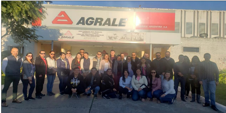
Imagen 10: Agrale

Es importante mencionar que la empresa AGRALE ha recibido en varias oportunidades solicitudes par cotizaciones de empresas de transporte de Colombia específicamente de la capital para el suministro de buses. Pero como se indica por parte de uno de los representantes de la compañía. Colombia a diferencia de otros países recibe para el transporte público diversidad de sistemas de buses, entre los que se incluyen a gas, eléctricos, diésel, y que además se manejan compras mediante sistemas de créditos considerables y la empresa no maneja esos sistemas de ventas.