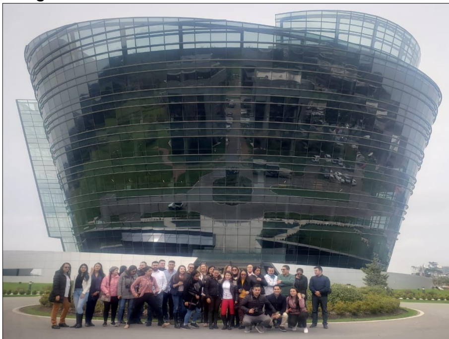
Imagen 4: Zona Américas – Ciudad de Montevideo

Realizando una comparativa con nuestro país natal, se observa que esta zona franca tiene un componente diferencial que es generado porque muchos de los negocios que están ubicados en la zona franca son de carácter tecnológico por lo cual dentro de la experiencia propia el nivel de tecnología y tipo de negocios que se manejan son más de carácter de servicios, diferenciado con las zonas francas conocidas en Colombia que se caracterizan por intercambio de mercancía con gran movilidad de camiones de carga pesada, bodegas de gran tamaño para almacenaje de mercancía.