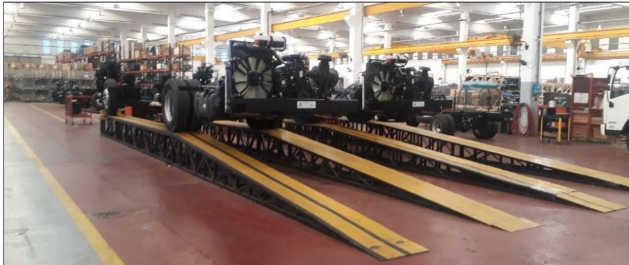
Imagen 9: Planta de producción Agrale

En el 2008 la empresa inicia operaciones en Argentina específicamente en Mercedes, provincia de Buenos Aires, sede de la visita, lo que da inicio a la expansión de la empresa a otros países claves para su actividad. Argentina como punto clave dado que por costos era más conveniente construir sus productos en este país que en Brasil. Decisión que es un éxito logrando en poco tiempo obtener casi el 50% del mercado de autobuses para suplir las necesidades de movilidad de pasajeros de las principales provincias del país, esto sumado a la presentación de nuevos modelos de tractores y camiones más eficientes y amigables con el medio ambiente.