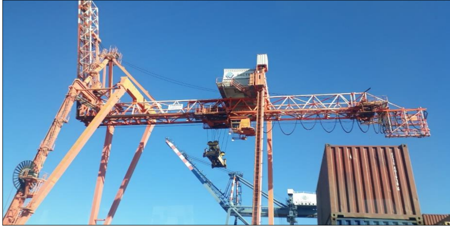
Imagen 11: Puerto de Buenos Aires

Cuenta con infraestructura adecuada que está en proceso de modernización para aumentar su capacidad de recepción de mercancía y así convertirse en un punto importante para la comercialización de productos en Latinoamérica.