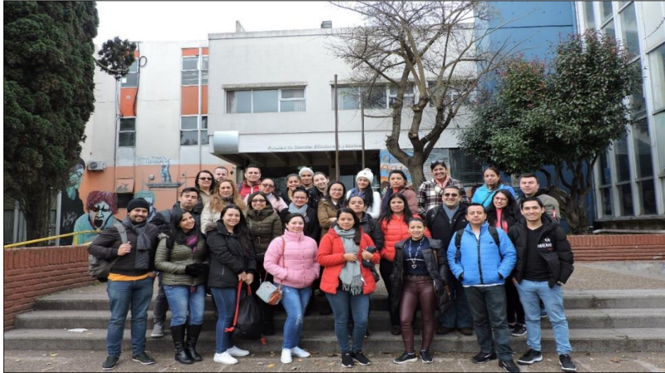
Imagen 2: Universidad Nacional de Mar del Plata

Taller de gran importancia ya que evidenciamos que en este país se presentan situaciones similares a las problemáticas que tenemos en Colombia y que así mismo ellos llevan a cabo procesos importantes de inclusión y capacitación para lograr que las poblaciones más vulnerables tengan mayores oportunidades mediante la generación de microempresas y negocios auto sostenibles en el largo plazo. Razón por la cual se consideraría importante fortalecer los lazos entre los países para intercambiar experiencias con el fin de disminuir la pobreza y mejorar las condiciones de la población, así como establecer canales para la comercialización de los productos que de estas poblaciones provengan esto generaría un plus dado que se aumentarían los canales de venta, los clientes y esto tendería a el crecimiento de estas microempresas.