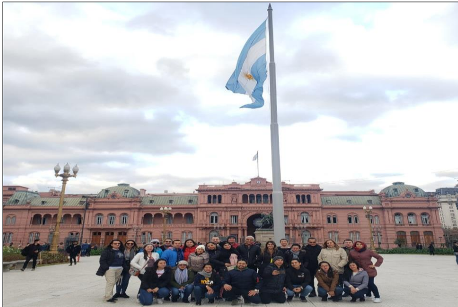
Imagen 13: Ciudad de Buenos Aires

Lastimosamente en los últimos años se vio empañado este país por acontecimientos de corrupción que afectaron al país económicamente, un golpe para la población que se observa con resentimientos al respecto de este tema. Es importante mencionar que lamentablemente se pudo observar mendicidad en las calles de su capital Buenos Aires y la sensación de inseguridad sobre todo en algunas partes de la ciudad es alta de lo cual se le advierte con mucha frecuencia a los turistas que la frecuentan.