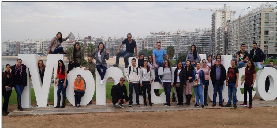
Imagen 12: Ciudad de Montevideo

Es un país muy seguro donde no se observó indigencia ni animales abandonados, calles con carros estacionados las 24 horas noche sin ningún peligro, gente con un buen nivel de cultura, sin embargo, se presentan evidencias situaciones normales como en Colombia en época de elecciones ya que suelen haber paros de los principales sectores laborales los cuales se dan previo a elecciones.