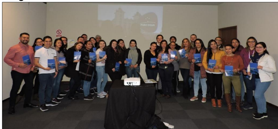
Imagen 7: Charla MERCOSUR

MERCOSUR toma sus decisiones a través de tres órganos; el Consejo de Mercado Común CMC órgano superior el cual conduce políticamente el proceso de integración, el Grupo Mercado Común GMC que vela por el funcionamiento del bloque y la Comisión de Comercio del MERCOSUR CCM encargada de la administración de los instrumentos comunes de política comercial.