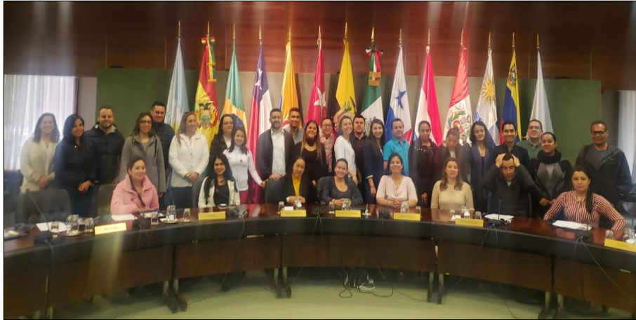
Imagen 5: Asociación Latinoamericana de Integración

La ALADI, para Uruguay como Colombia representa un grupo importante para la generación de relaciones comerciales que brinden oportunidades de intercambio de productos y tecnología, aprovechando el conocimiento de otros países para mejorar las condiciones productivas.