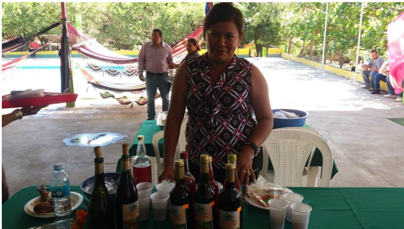
Lanzamiento Verano-Vino elaborado en Mateare.