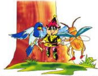
Cerca de un árbol de haya fue cogido el fugitivo por un bicho y una urraca.