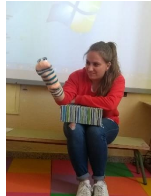
Ilustración 21. Intervención de la marioneta

Descripción general. Esta actividad consiste en narrar un cuento a los niños. La protagonista de todas las historias será Lisa, una marioneta. Este cuento es de elaboración propia y hay uno específico para cada país. Además, a la hora de narrar el cuento nos apoyaremos en una presentación interactiva, también de elaboración propia. En el mostraremos el mapamundi y la localización del país que estemos trabajando. Esta será la actividad introductoria al tema, que utilizaremos como motivación inicial para seguir conociendo el país en cuestión.