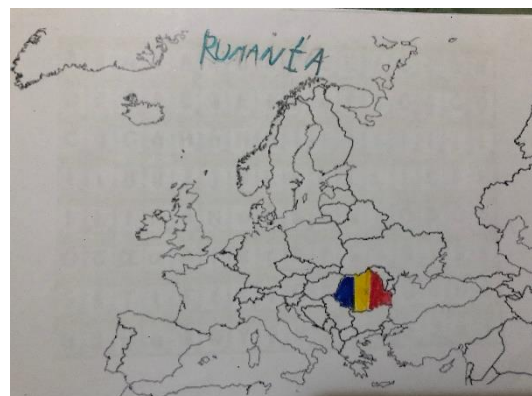
Ilustración 3. Localización de Rumanía en el mapa

Descripción general. Esta actividad servirá para localizar el país que estemos trabajando, primero dentro de su continente, luego en el mapamundi y si está lejos o cerca de España- En la pizarra digital vamos a ver un mapa del continente del país y en color rojo estará pintado donde se ubica el país. También buscaremos ese continente e intentaremos ubicarlo dentro de la bola del mundo que tenemos en clase. Una vez localizado, veremos donde se encuentra España y ese país y a continuación lo buscaremos en un mapa en blanco que aportará la maestra. Cuando lo localicemos pintaremos dicho país y lo añadiremos a nuestro cuaderno.