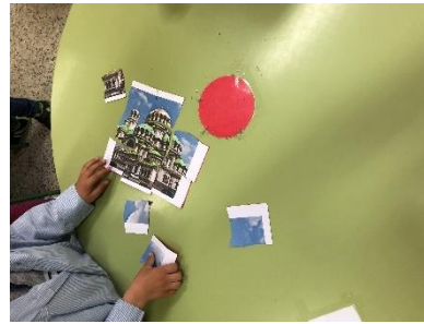
Ilustración 5 y 6. Juego para conocer los lugares emblemáticos