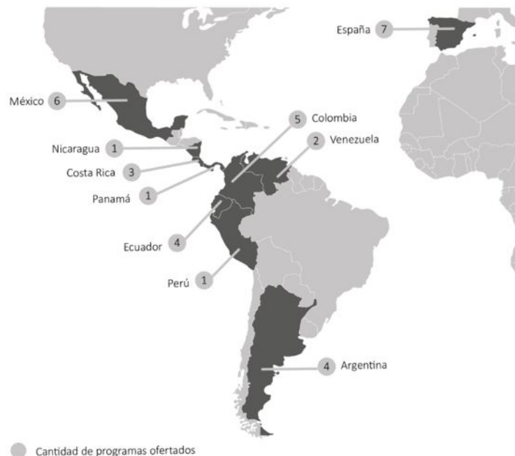
FIGURA 4 Cantidad de programas de maestría en economía social en España y países hispanohablantes de Latinoamérica