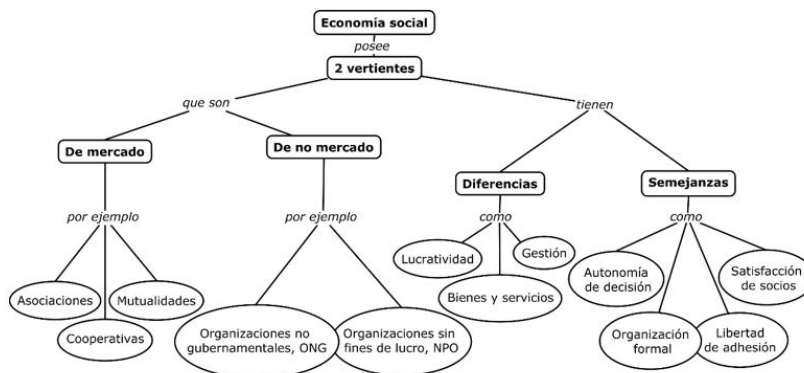
FIGURA 1 Dos vertientes de la economía social

La economía social se define en dos vertientes: la de mercado y la de no mercado, que se muestran en la Figura 1. En ambas vertientes las empresas son organizadas formalmente, con autonomía de decisión, libertad de adhesión y buscan satisfacer las necesidades de los socios. La vertiente de mercado produce bienes y servicios y la toma de decisiones ahí no está ligada a los aportes de capital, mientras que, en la de no mercado se producen servicios a favor de la familia y los excedentes no son de apropiación de los agentes económicos (Chaves et al., 2013; Pérez de Mendiguren, Etxezarreta y Guridi, 2008).