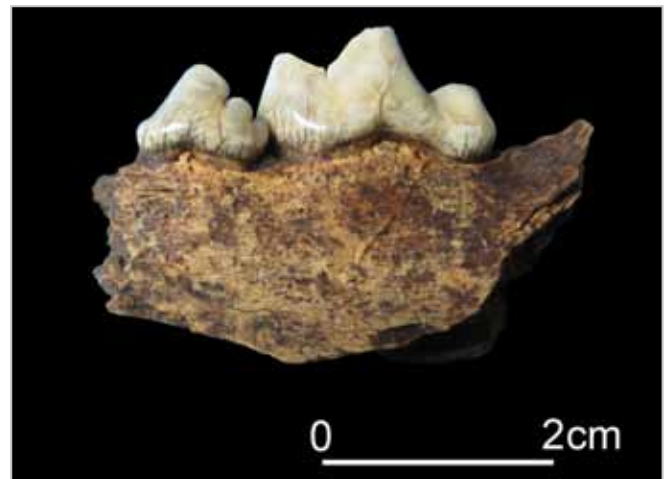
Fig. 4. Cane: frammento di emimandibola sinistra.

Il bue, di piccola taglia, risulta l'ungulato più frequente in quasi tutte le fasi. Le parti anatomiche sono relative al cranio, agli arti ed allo scheletro assiale (Tab. 2). In US 8 è stato rinvenuto un metatarso sinistro ed una seconda falange con esostosi probabilmente dovute all'utilizzo dell'animale per forza lavoro (Fig. 3). Nella valutazione delle classi di età sono più frequenti gli in-