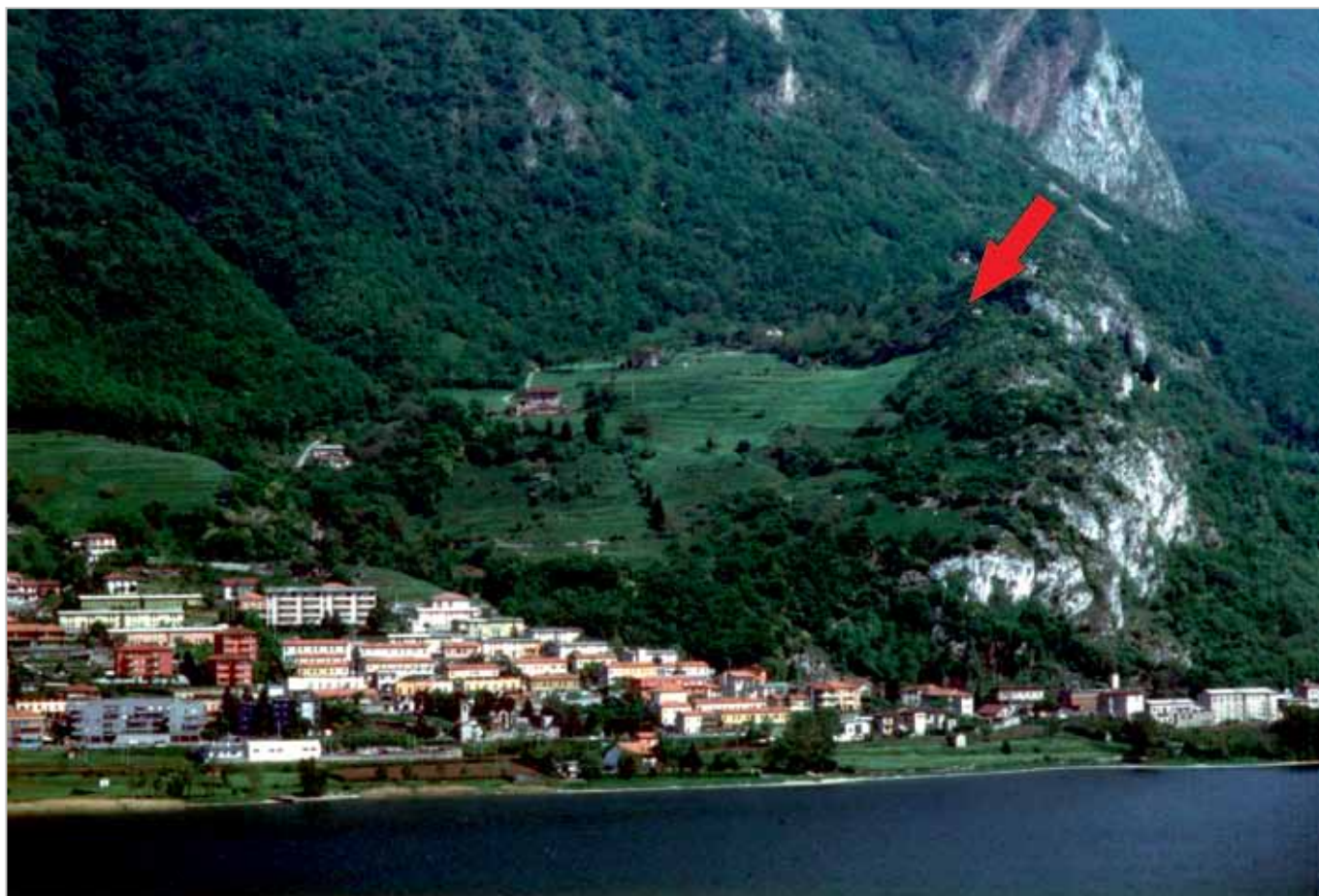
Fig. 1. Lago di Garlate e collocazione del sito di Chiuso La Rocca.