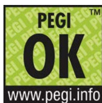
Logo PEGI OK

Ikona PEGI Online jest umieszczana na opakowaniach gier lub w samej witrynie internetowej. Logo wskazuje, czy w dany tytuł można grać w sieci i czy produkt lub witryna jest kontrolowana przez operatora dbającego o ochronę młodzieży. Ikonę PEGI Online mogą umieszczać firmy, które wykazały, że w swoich działaniach kierują się zasadami określonymi w Kodeksie bezpieczeństwa PEGI Online – m.in. sprawdzają, czy ich strony nie zawierają treści niezgodnych z prawem lub nieadekwatnych do wieku osób z nich korzystających, dbają o ochronę danych osobowych użytkowników, podają rzetelne informacje na temat treści gier itp.