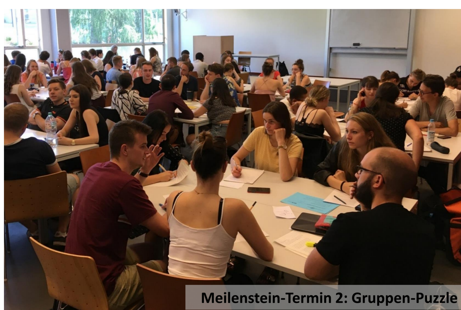
Meilenstein-Termin 2: Gruppen-Puzzle