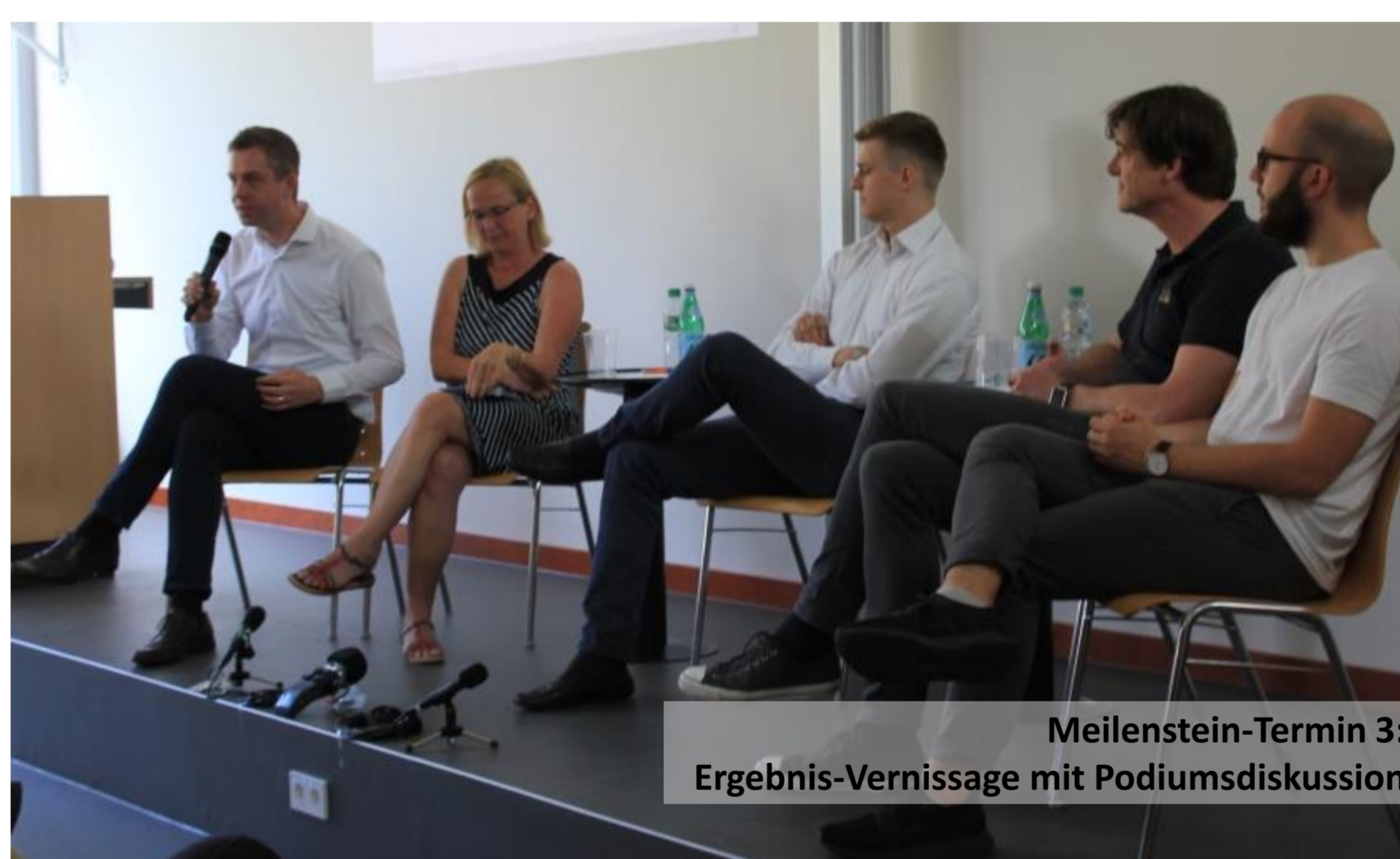
Meilenstein-Termin 3: Ergebnis-Vernissage mit Podiumsdiskussion