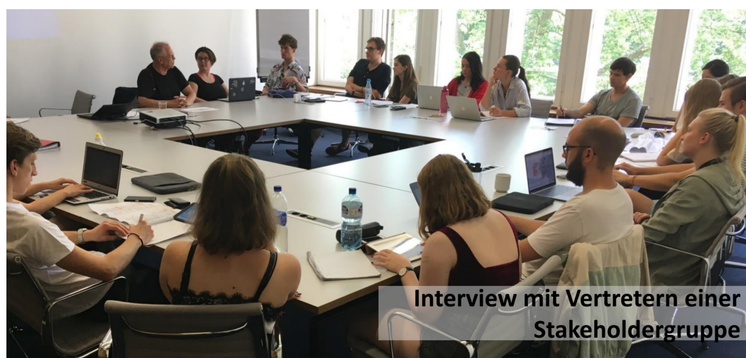
Interview mit Vertretern einer Stakeholdergruppe