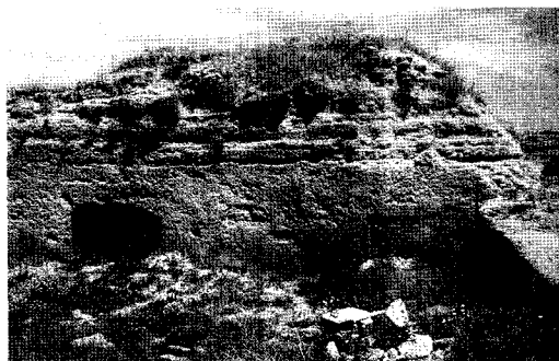
Figura 1. Hornos de cal de albero en desuso (Alcalá de Guadaíra, Sevilla)

La fabricación de cal de albero, que se ha hecho artesanalmente en caleras de tipo «moruno» (figura 1), utilizando como combustible carbón vegetal y leña (se pueden observar restos inquemados en los morteros antiguos de esta cal), daba lugar a una cal «basta» de un característico color que solía oscilar entre rosagrisáceo y rojo teja oscuro.