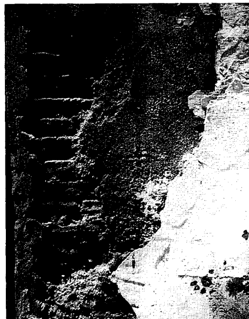
figura 4. Morteros de albero en muros y en revestimientos