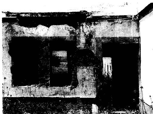
figura 3. Morteros de albero en muros y en revestimientos

Como características generales de estos morteros, se puede decir que han ofrecido unos resultados constructivos satisfactorios, presentando estabilidad dimensional frente a los cambios térmicos, elevadas resistencias mecánicas en las zonas húmedas y poseer un color resultado de la mezcla del rojo-rosáceo de la cal de albero, el ocre del albero o marrón de la arena.