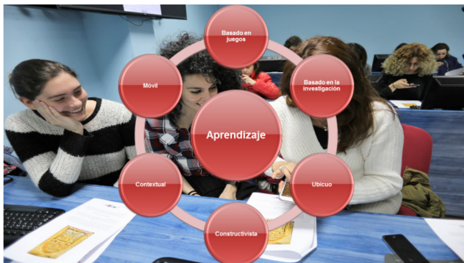
Figura 1. Modelos teóricos que le pueden dar cobertura teórica a la utilización educativa de la RA.

De todas formas, aun reconociendo la falta de cobertura teórica para justificar su incorporación a la enseñanza, tampoco se puede negar que se están llevando a cabo propuestas de utilización que parten de la idea de que las soluciones de incorporación no pueden residir en un único paradigma educativo, sino más bien en una mezcla de enfoques pedagógicos (Tarng y Ou, 2012; Bower et al. , 2014). Y, en este sentido, el aprendizaje constructivista, aprendizaje situado, aprendizaje inductivo, y aprendizaje basado en juegos son los que se presentan con fuertes posibilidades para la fundamentación. Por otra parte, la teoría de la variación, formulada inicialmente por Mazur (1997), sugiere que las situaciones enriquecedoras del aprendizaje son aquellas que ponen en una situación al estudiante donde tiene que experimentar o analizar para cambiar su concepción inicial, y donde también puede aportar pistas y sugerencias para su utilización educativa. En este sentido, existen una síntesis de las teorías de aprendizaje en las cuales se puede apoyar su utilización educativa (Figura 1).