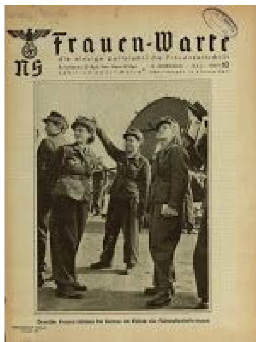
Frauen Warte, 1944