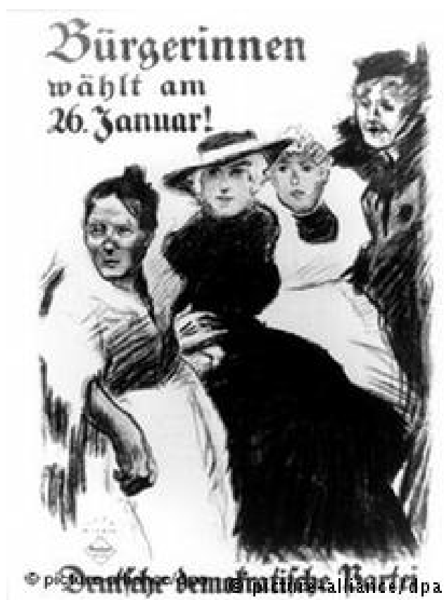
Llamamiento al voto para la Asamblea Regional.

Estos avances en el rol femenino que establece la Constitución de Weimar se deben, en gran medida, a las llamadas “sufragistas”. El 19 de enero de 1919 las mujeres alemanas ejercían por primera vez su derecho al voto. La participación femenina fue de un 82,3% y casi el 9% de la Asamblea Nacional fue ocupado por mujeres.