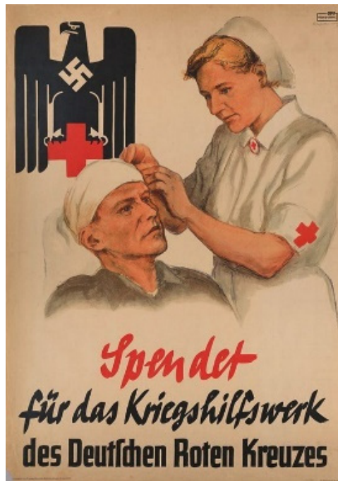
"Dona para el auxilio de la Cruz Roja Alemana". Propaganda del tercer Reich