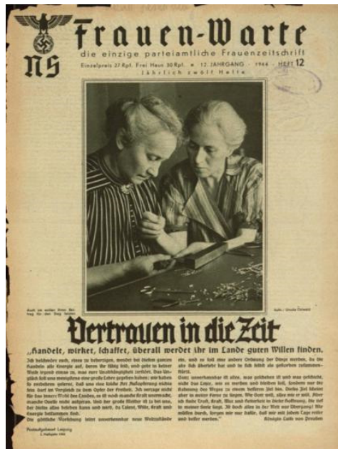
Frauen Warte, 1944