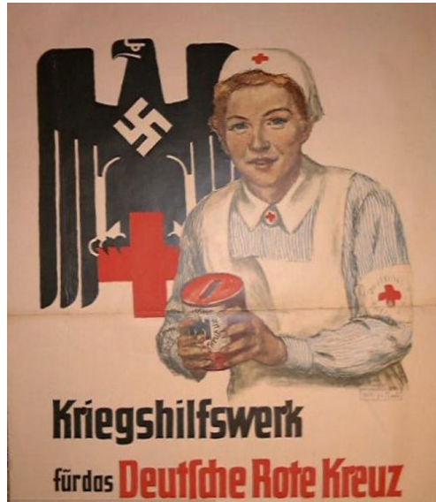
"Auxilio de Guerra de la Cruz Roja Alemana". Propaganda del tercer Reich