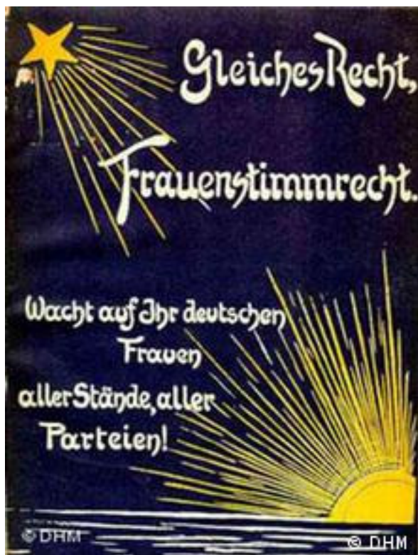
Cartel de 1907: "El mismo derecho. Sufragio femenino. ¡Despertad, mujeres alemanas de todas las condiciones, todos los partidos!".

La República de Weimar, por tanto, comprendía el papel de la mujer en las universidades y la inserción laboral. La política era otro de los sectores donde la mujer tomó protagonismo. Clara Zetkin o Rosa Luxemburgo, por ejemplo, son solo dos de los nombres propios que dejó la lucha por la igualdad en este período histórico.