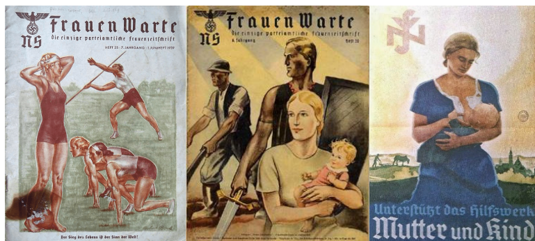
Portadas de la revista Frauen Warte que se encargaba de difundir los valores y aptitudes de la mujer del Tercer Reich.

La liga Nacionalsocialista de Mujeres nace en 1931 como la rama femenina de las Juventudes Hitlerianas. En ella ingresaban las jóvenes arias con edades comprendidas entre los 10 y los 21 años. El objetivo de la Liga dar una educación deportiva y sana, inculcar las tradiciones alemanas y enseñar a la mujer las labores del hogar.