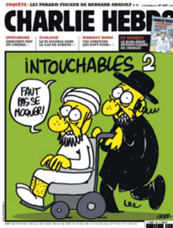
Figura 10: Caricaturas de Charlie Hebdo (AFP, 2012)

fre estas críticas que no son verdad y que han generado una falsa opinión bastante arraigada en el mundo occidental idealizado.