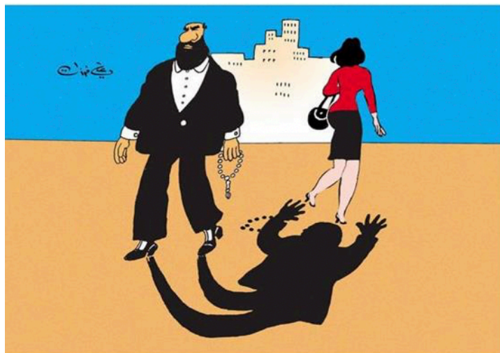
Figura 5: La doble moralidad y la opresión de la mujer (Ferzat, n. d.)

En esta imagen se aprecia un hombre y una mujer en una ciudad. La mujer está de espaldas y camina tranquilamente. No obstante, el hombre reza tal como se observa con su tasbeeh , pero su sombra muestra lo contrario. La sombra enloquece al ver pasar a la chica vestida de rojo, hasta tal punto de considerarla un objeto sexual. Por ello, el significado de la caricatura es bastante claro: se critica la doble moralidad que la sociedad ejerce usando el islam como excusa que llega a discriminar a la mujer y considerarla como una verdadera víctima de la sociedad.