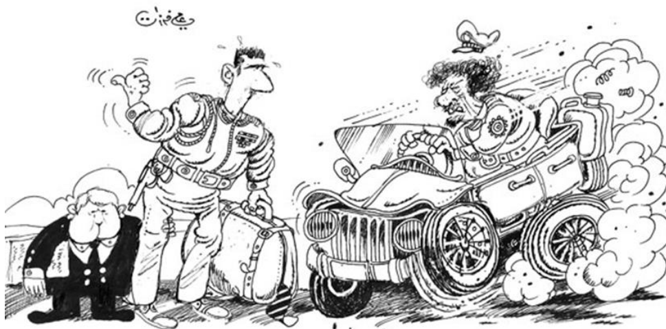
Figura 8: Bashar al-Asad y Muammar al-Gaddafi escapando juntos (Ferzat, n. d.)

jar. De hecho, actualmente, sigue dibujando y publicando sus dibujos en internet y las redes sociales para llegar a todos los rincones del planeta, relatando la situación de Siria (Farzat, 2012).