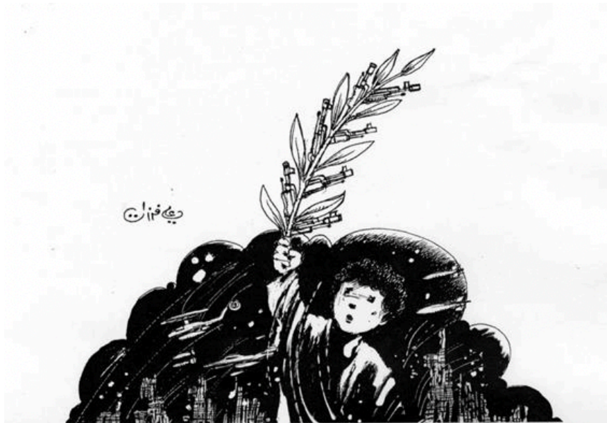
Figura 6: La tragedia de los niños (Ferzat, n. d.)

En esta caricatura aparece un fondo con un escenario en guerra y en un primer plano hay un niño. Este niño tiene cara triste y en su mano porta una rama de olivo para reclamar la ansiada paz que no llega. Pero, esta rama de olivo incluye cañones de armas que simbolizan esa guerra. Por tanto, pretende resaltar al niño como una víctima importante, dado que ha perdido su inocencia y su niñez y no ha conocido otra cosa que el arte de la guerra. Asimismo, este niño crecerá y no conocerá otra cosa que ese ambiente hostil en el que le ha tocado crecer.