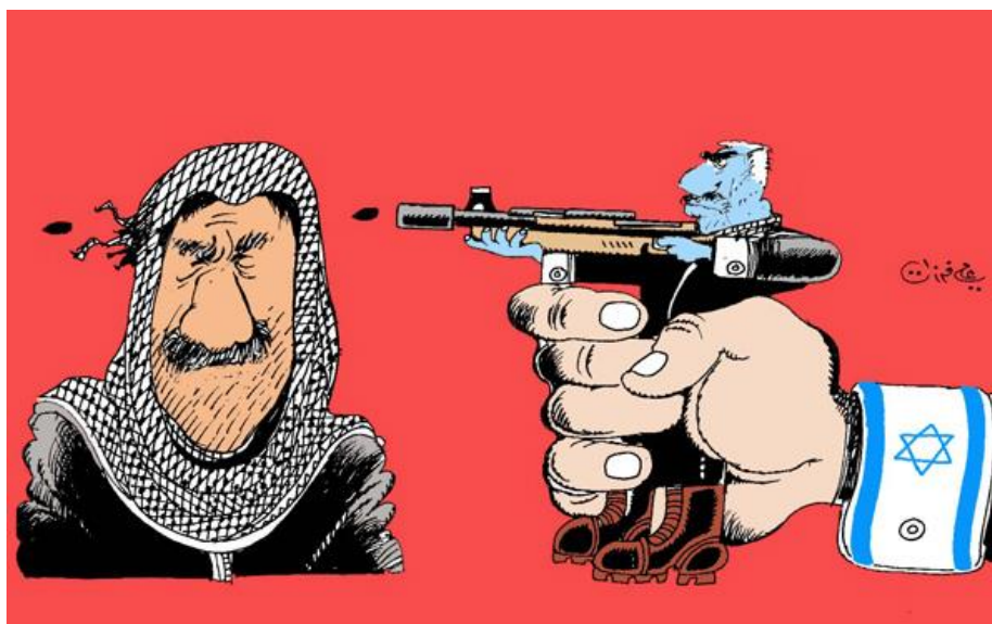
Figura 3: El acoso de Israel al mundo Árabe (Ferzat, n. d.)

Por otro lado, el siguiente símbolo, la Estrella de David, está relacionado con los dos anteriores, dado que es una crítica a uno de los grandes conflictos existentes en Oriente Medio que muchas veces pasa desapercibido. Se trata de la guerra entre Israel y Palestina, que aún no ha terminado y que los caricaturistas quieren reflejarla en sus dibujos (Qassim, n. d., 44-47).