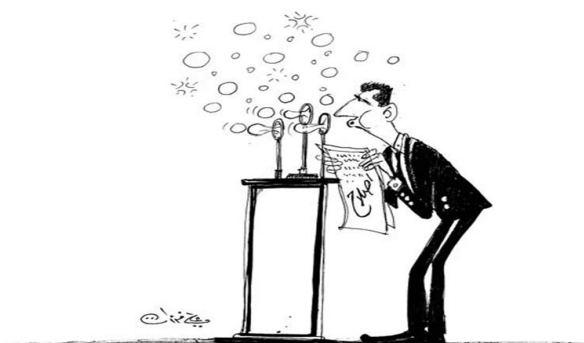
Figura 2: El discurso del presidente (Ferzat, n. d.)

En cuanto al siguiente símbolo, deriva en parte del anterior. Este tipo de símbolo pretende criticar la legitimidad del presidente, recogida en los medios de comunicación (Camps-Febrer, 2012, pp. 26-37). Se pretende ridiculizar al enemigo mostrando, la agresividad, la arrogancia y la sed de sangre en numerosas imágenes con el fin de destacar la vileza de los villanos (Qassim, n. d., 32-35). Por tanto, este símbolo contribuye a que se refleje el contexto político, la atmósfera de las libertades y opresiones, la resistencia de la sociedad y las críticas a las estructuras políticas (Camps-Febrer, 2012, pp. 26-37)