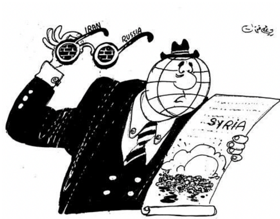
Figura 4: La ignorancia del mundo (Ferzat, n. d.)

otro lado al encontrarse con los problemas de Oriente Medio (Qassim, n. d., pp. 47-49).