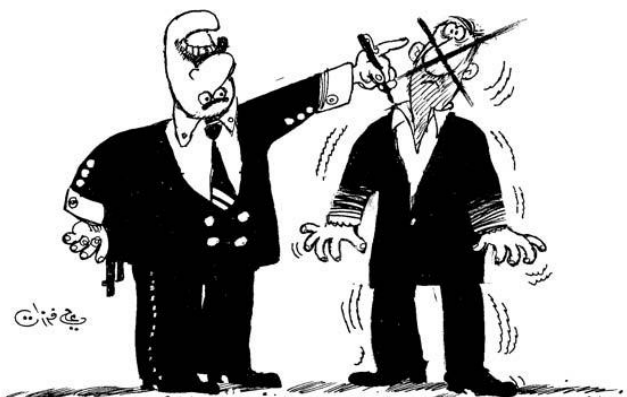
Figura 1: Los hombres de traje (Ferzat, n. d.)

En este ejemplo se observa lo comentado anteriormente. El primero tiene la cabeza del revés y viste un traje ostentoso, lleva anillos en sus manos y una pistola en la cadera, al mismo tiempo que le tacha con un bolígrafo la cara al otro hombre para representar la fuerza y el poder. Por otro lado, el otro hombre tiene cara de asombro y presenta un traje más sencillo que se borra paulatinamente, mientras el otro hombre lo va tachando. Por tanto, el significado de esta caricatura es resaltar la opresión de los ciudadanos a través del gobierno.