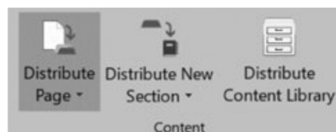
Рис. 1. Варианты повторного использования материалов КП – распространение всем учащимся отдельных страниц и секций КП, а также пополнение библиотеки материалов в OneNote Class Notebook

Возможность переноса материалов из прошлогодних КП, а также любых других КП (рис. 1) позволяет сократить до минимума время на подготовку КП к занятию/тесту/контрольной работе.