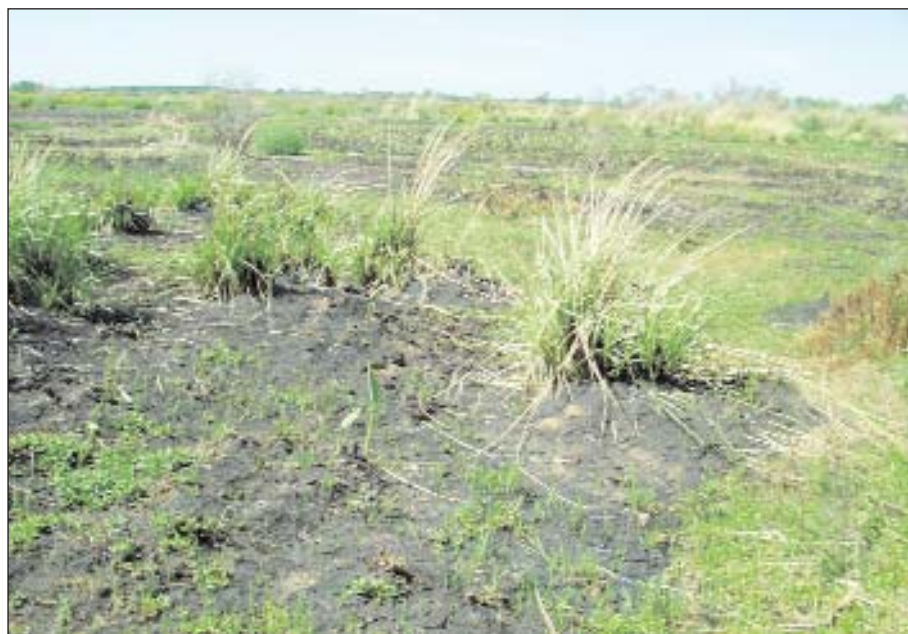
Figura 2: Media loma con pajonal de Panicum prionitis alcanzado por el fuego.