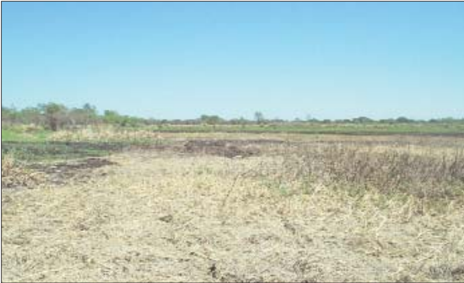
Figura 3: Bajo con achira ( Thalia geniculata ), canutillo ( Panicum elephantipes ) y verdolaga ( Ludwigia sp.) alcanzado por el fuego.