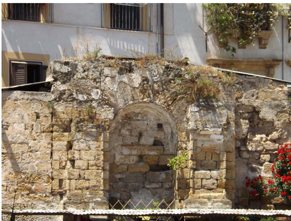
Fig. 2. Resti della chiesa di S. Teodoro in piazzetta delle Vergini, Palermo.

elementi reali e leggendari – quello di S. Teodoro, di età bizantina: è menzionato in una lettera del 601 di Gregorio Magno in cui si davano indicazioni circa la ricostruzione di uno xenodochium , una casa di accoglienza per forestieri, sui resti di quello di S. Teodoro, fondato da un diacono di nome Pietro, amministratore locale dei beni della Chiesa (Pirri, 1987, p. 24; Carta, 1969, pp. 43-45; Zorić, 1998). L'origine andrebbe dunque collocata tra il VI secolo, epoca dalla quale la Chiesa in Sicilia si organizzò in forma ufficiale, e la data appunto del 601 5 : sorto come ricovero per pellegrini, lo xenodochium si sarebbe trasformato in ospedale (Carta, 1969, p. 45). Distrutto dagli arabi, sarebbe rinato con i normanni con una nuova configurazione: il monastero delle Vergini, con una chiesa dedicata a S. Teodoro, affidato in un primo tempo alle monache basiliane e poi alle benedettine (Mongitore, 1708, pp. 166 e ss.) 6 , di cui oggi rimangono pochi resti.