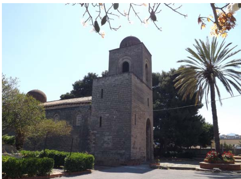
Fig. 3. Chiesa di S. Giovanni dei Lebbrosi, Palermo.

stato fondato dallo stesso Ruggero II in considerazione dell'insalubrità del luogo a causa dei miasmi del fiume Oreto (Russo, 1975, p. 129) 15 . Il decadimento economico del lebbrosario sarebbe divenuto così grave da persuadere Federico II di Svevia, nel febbraio 1219, a annettere chiesa e ospedale all'Ordine dei Cavalieri Teutonici della Magione (Garufi, 1940, p. 47), che lo detenne fino alla fine del XV secolo ( L'arte siculo-normanna , 2005, p. 115). Interessante un documento del 1305 in cui Federico III d'Aragona diede mandato ai gabelloti delle tonnare siciliane di fornire gli otto tonni l'anno dovuti all'Ospedale di San Giovanni Infectorum di Palermo, testimonianza del fatto che il sostentamento alimentare di S. Giovanni fu a carico della Magione dei Teutonici (Lo Cascio, 2011, doc. 451, p. 245).