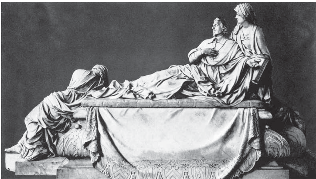
3. Spomenik kardinalu Richelieuu, 1675.–1694., Pariz, kapela u Sorbonni, François Girardon Monument of Cardinal Richelieu by François Girardon, 1675–1694, chapel at Sorbonne in Paris

smrtnošću smješten u donji, zemaljski registar, a trijumf umrlih nad njom u gornji, nebeski registar kompozicije, u središnjem je smještena skulptura Vremena, prikazana u liku muškarca koji u maniri gospodara nonšalantno oslonjena na poklopac sarkofaga kažiprstom upire prema njegovoj unutrašnjosti.