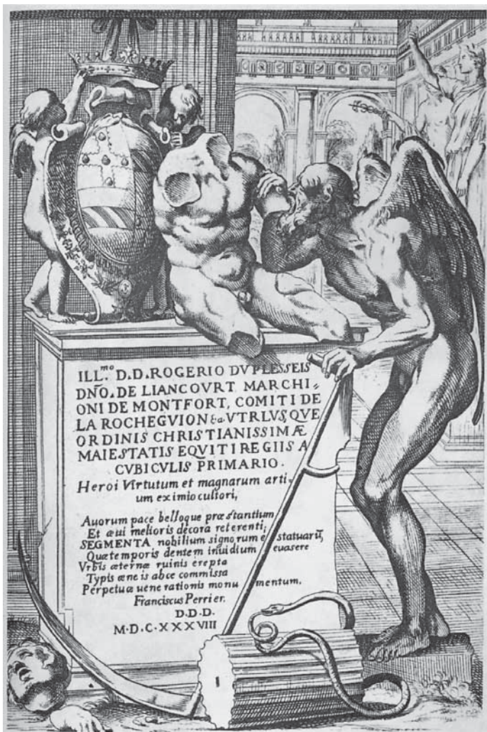
9. François Perrier, Vrijeme, 1638. François Perrier, Time, 1638