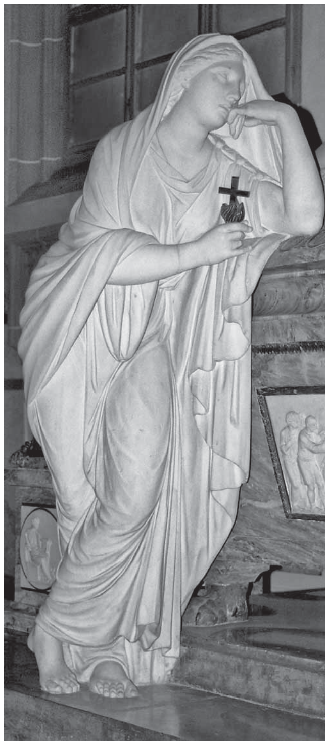
12. Religija (Germanija), kenotaf Leopolda I. Habsburškog, 1795., Beč, Crkva augustinaca, Franz Anton Zauner