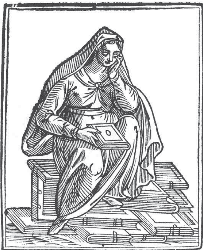
6. Meditacija (prema Tozzijevu izdanju Ripine Ikonologije, 1618.) Meditation (according to Tozzi's edition of Ripa's Iconology, 1618)