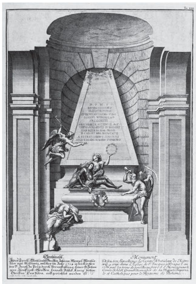
4. Nacrt spomenika grofu Wratislavu von Mitrowitzu, 1714., Johann Bernhard Fischer von Erlach

Design for the monument of Count Wratislav von Mitrowitz by Johann Bernhard Fischer von Erlach, 1714