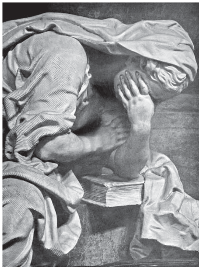
7. Žalujuća figura, spomenik grofu Wratislavu von Mitrowitzu, 1715.–1716., Prag, Crkva sv. Jakova, Ferdinand Maximilian Brokof A mourning figure from the monument of Count Wratislav von Mitrowitz by Ferdinand Maximilian Brokof, 1715–1716, St James' church in Prague

i obimom, užasom i uzvišenošću pojma vremena kao što je bio barok«, razdoblje u kojem se čovjek suočio s beskonačnošću kao osobinom univerzuma, a ne Boga. 25 Uobličivanje Vremena u liku naga ili oskudno odjevena krilatog starca, s pješčanim satom i kosom, kakva nalazimo u Fischerovoj grafici, bilo je uobičajeno tijekom renesanse i baroka. 26 Fischerov prikaz Vremena u obliku staračke prilike povijenih leđa, prikazane u lijevom poluprofilu, naglašena pokreta, čime se aludira na brzi tijek vremena, uklapa se u dugi niz srodnih kompozicijskih rješenja koja se mogu pratiti od početka 17. stoljeća i kakva je Fischer zacijelo imao pred očima oblikujući svoju figuru. Općim obilježjima srodnu priliku dugobrađa krilatog starca naći ćemo primjerice na tipično maniristički figurama i simbolima napućenoj grafici koja prikazuje slikara Bartholomäusa Sprangera i njegovu pokojnu ženu Christinu, radu Aegidiusa Sadelera iz 1600. godine. 27 Slično kao i na von Mitrowitzevu spomeniku i sukladno komemorativnom sadržaju djela, u grafici je silovitu hodu i zamahu figure Vremena kompozicijski i značenjski suprotstavljena figura Fame s trubljama, u pratnji anđela s lovor-vijencem.