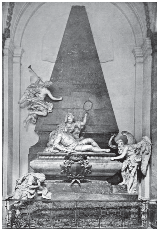
5. Spomenik grofu Wratislavu von Mitrowitzu, 1715.–1716., Prag, Crkva sv. Jakova, Ferdinand Maximilian Brokof

Design for the monument of Count Wratislav von Mitrowitz by Johann Bernhard Fischer von Erlach, 1714