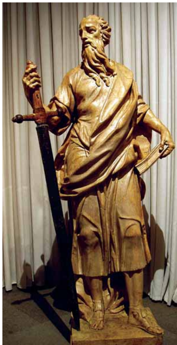
Giovanni Marchiori, Sveti Pavao , Stalna izložba crkvene umjetnosti, Zadar

Giovanni Marchiori, St. Peter, Permanent Exhibition of Religious Art, Zadar