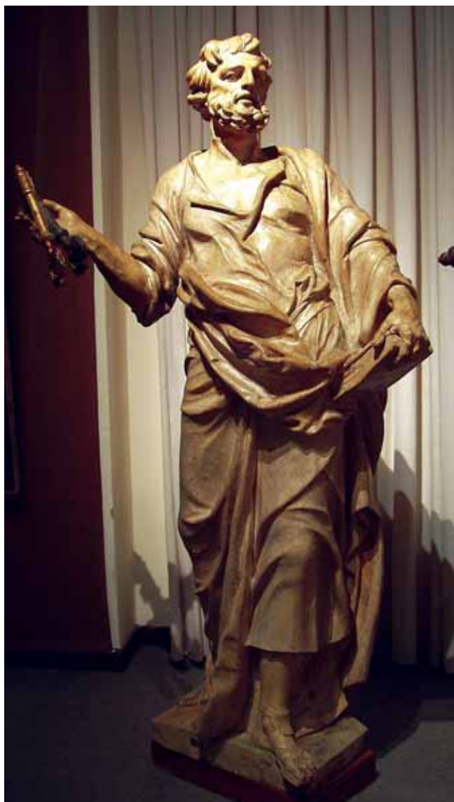
Giovanni Marchiori, Sveti Petar , Stalna izložba crkvene umjetnosti, Zadar

Giovanni Marchiori, St. Peter, Permanent Exhibition of Religious Art, Zadar