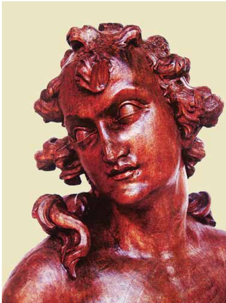
Giovanni Marchiori, Adonis , privatna zbirka, Italija Giovanni Marchiori, Adonis, Private collection, Italy

Rocco u Veneciji kao i kipovi pod pjevalištem crkve posvećene istom svecu. Riječ je o Davidu i Sv. Ceciliji , koje je kipar izradio 1741.–1743. godine. 18 Reljefe iz Scuola Grande di San Rocco publicirao je u bakropisu Giorgio Fossati već 1751., kao ilustracije uz Vita del gloriosso San Rocco . 19 U drugoj polovici četrdesetih godina 18. stoljeća nastaju brojna umjetnikova djela, poput oltara s kipovima Presvetog Trojstva s dva anđela u Oratoriju Pezzana u Carpenedu di Mestre, a krajem istog desetljeća i kipovi svetih Gervazija i Protazija na glavnom oltaru Župne crkve u Corbaneseu. 20 Godine 1750. kardinal Angelo Marija Querini naručuje mramornu grupu Uskrsli Krist pred Marijom Magdalenom za berlinsku Crkvu svete Hedvige, danas u Crkvi svete Marije u Berlinu. Godine 1753. skulptor izrađuje kip svetog Petra za glavni oltar venecijanske crkve Santa Maria della Pietà. 21 Marchiori 1756. postaje član mletačke Akademije, a krajem pedesetih seli svoju radionicu u Treviso. Uprkos tomu on i tijekom šezdesetih godina ostvaruje radove u Veneciji, poput kipova na fasadi Crkve svetog Roka. 22