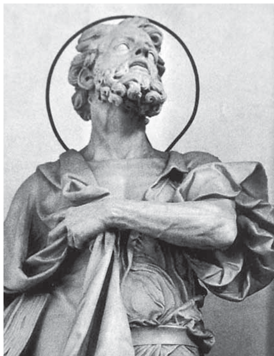
Giovanni Marchiori, Sveti Petar , Santa Maria della Pietà, Venecija, detalj Giovanni Marchiori, St. Peter, Santa Maria della Pietà, Venice, detail