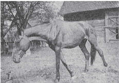
Slika 1. Treći opisan slučaj, kobila vlasništvo Stjepana Vujnovića iz Kurilovca. Kobila nije u pokretu, već stoji u posve neprirodnom položaju (izvor: Kucel, 1938.).

Prema zapisima dr. Kucela, veterinara u Velikogoričkom srezu prvi slučaj bolesti zabilježen je 3. kolovoza 1938. godine u kobila iz Rakarja. Prema opisu veterinara koji je obavio klinički pregled, kobila je pokazivala apatiju i umor, a vlasnik je smatrao da se radi o umoru, jer je kobila radila teške poslove, a osim toga imala je i ždrijebe zbog čega je oslabila. Zdravstveno stanje se za nekoliko dana znatno pogoršalo. Javljali su se teški napadi koji su se očitovali besvjesnim udaranjem glave u zid. Zbog toga su je izveli iz štale i čuvali da se ne ozlijedi. Pregledom je ustanovljena velika oteklina iznad lijevog oka, po cijeloj glavi i po kukovima. Daljnjim je pregledom uočeno da su konjunktive hemoragične i malo ikterične. Moglo se primijetiti da kobila nije reagirala na podražaje. Pokušavajući ići naprijed to je činila posve nesvjesno, ne uočavajući nikakve prepreke i udarajući u prepreke na koje je nailazila. Kretanje je nekoordinirano i neprirodno, kobila bi stala, oborila glavu i izgledala je