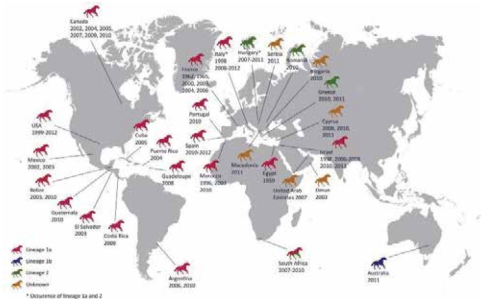
Slika 5. Slučajevi VZN u konja službeno prijavljeni u cijelom svijetu (OIE) ili objavljeni u literaturi od 1959. godine (Izvor: Angervoorst i sur., 2013.).

Na slici 5 prikazane su zemljopisne lokacije i vrijeme izbijanja VZN u kopitara. Godine 1959. dokazani su serološki pozitivni konji i VZN je izdvojen iz oboljelih konja u Egiptu. Kasnije 1962.