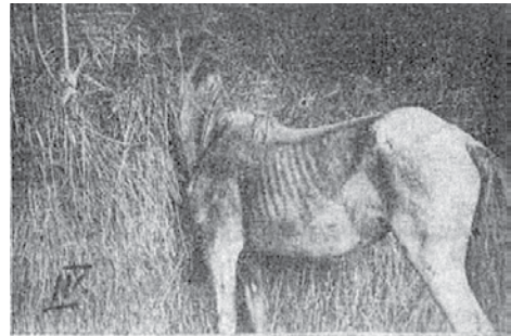
Slika 2. Kobila vlasništvo Stjepana Cvetnića iz Mraclina u teškom polusvjesnom stanju gura glavu u sjenik i ostaje u tom položaju.

Peti sporadički slučaj dogodio se u Rakarju 19. rujna 1938. godine, a odmah zatim i šesti slučaj u mjestu Mraclin. Kobila je u teškom polusvjesnom stanju gurala glavu u sijeno i ostala u takvom položaju. Zbog velikog interesa klinike Veterinarskog fakulteta ova kobila poslana je u Zagreb. Unatoč poduzetoj terapiji kobila je ubrzo uginula (slika 2.).