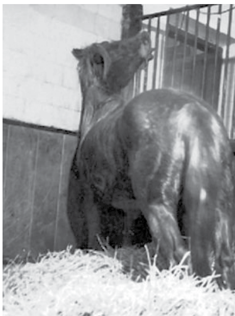
Slika 4. Nekontrolirani pokreti i nasrtanje na prepreke koje su prouzročile ozljede glave, nogu i tijela, bili su čest klinički znak.

Poznato je da je 25 konja uginulo te su odvoženi na stočno groblje u blizini sela (Novi gaj). Tamo su veterinarski patolozi obavljali razudbu i uzimali potreban materijal za laboratorijske pretrage. Smatra se da je tada jedan od patologa bio i čuveni patolog i sudski vještak, po struci liječnik, profesor Ljudevit Jurak, osnivač Zavoda za patologiju Veterinarskog