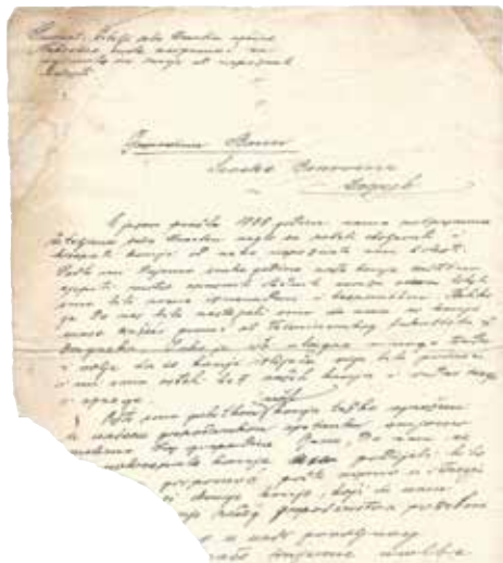
Slika 6. Kopija pisma žitelja Mraclina banu Savske Banovine kojim traže pomoć.

Banovine i tražili su pomoć i sanaciju šteta koje im je nepoznata bolest konja prouzročila. Međutim ne zna se je li ta pomoć do njih ikada stigla (slika 6.)