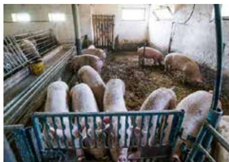
Slika 2. Farma B - tov svinja na punom podu, uz svakodnevno steljenje i čišćenje.