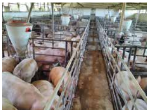
Slika 1. Farma A - tov svinja na polurešetkastom podu.

Dobrobit tovljenika procijenjena je na temelju Welfare Quality® protokola (2009.), putem različitih načela, kriterija i mjera. Protokol uključuje 4 načela (Dobra hranidba, Dobar smještaj, Dobro zdravlje i Prikladno ponašanje), 12 kriterija (Izostanak dulje gladi i žeđi, Udobnost pri odmoru, Toplinska udobnost, Lakoća kretanja, Izostanak ozljeda, Izostanak bolesti, Izostanak boli prouzročene uzgojnim praksama, Izražavanje društvenog ponašanja, Izražavanje drugih ponašanja, Dobar odnos čovjek-životinja, Pozitivno emocionalno stanje) i oko 30 mjera za procjenu dobrobiti svinja. Prema tom protokolu, prvo se u proizvodnoj jedinici obavlja procjena dobrobiti pomoću pojedinih mjera. Zatim se te vrijednosti grupiraju kako bi se izračunale vrijednosti kriterija, koje se pak koriste za izračun vrijednosti načela. U konačnici, dobrobit životinja na ukupnoj razini farme procjenjuje