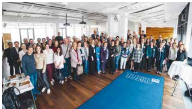
Slika 2. Sudionici konferencije o suši

Osim rezultata pojedinih radnih paketa projekta DriDanube, na konferenciji su predstavljena i iskustva upravljanja sušom u pojedinim državama (Austriji, Sloveniji, Slovačkoj, Njemačkoj, Belgiji i SAD-u) kao primjer dobre prakse donosioca odluka te sinergije među sektorima.