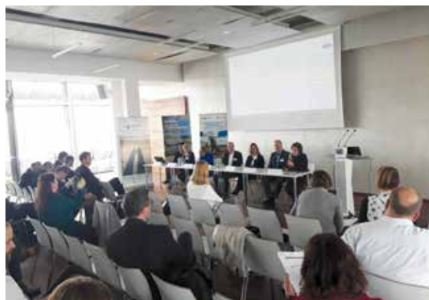
Slika 3. Okrugli stol o mogućnostima upravljanja sušom

Zaključeno je da iako su uglavnom svi aspekti suše dobro istraženi i poznat je njihov učinak na pojedini sektor (vodno gospodarstvo, poljoprivreda, energetika, bioraznolikost, plovidba...), za uspješno upravljanje sušom ključna je kvalitetna međusobna komunikacija svih dionika, integrirani i proaktivni pristup.