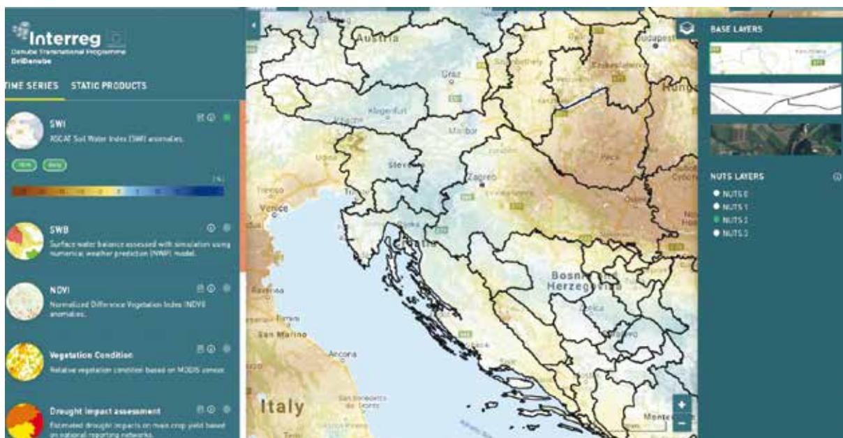
Slika 4. Sučelje geoportala Drought Watch, www.droughtwatch.eu

Razvili su ga projektni partneri Space SI (Slovenija) i Bečko tehničko sveučilište (TUW) iz Austrije, a temelji se na dostupnim satelitskim produktima. Ova platforma je potpuno besplatna, dostupna svima i takva će ostati i nakon završetka projekta. Platforma je jednostavna za upotrebu i njezino korištenje, ne zahtijeva neka posebna tehnička znanja. Glavne informacije na platformi su prevedene na sve jezike zemalja partnera kako bi se omogućila dostupnost informacija što većem broju korisnika.