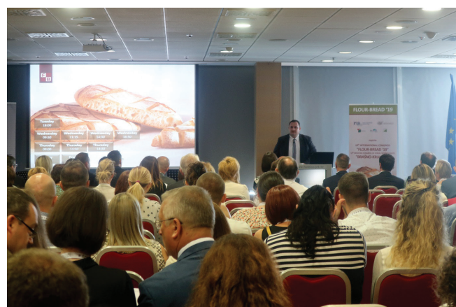
Slika 1 – Kongres "Brašno-Kruh '19" otvorenim je proglasio osobni izaslanik ministra poljoprivrede doc. dr. sc. Krunoslav Dugalić, ujedno i ravnatelj Agencije za poljoprivredu i hranu

3 stručne radionice s 5 stručnih predavanja 13 izlagača laboratorijske i procesne opreme 1 sastanak predstavnika međunarodne udruge Global Harmonization Initiative 1 završna konferencija IRI projekta