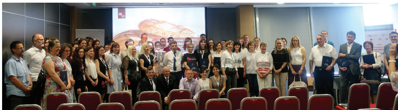
Slika 6 – Skupna slika sudionika preostalih na zatvaranju Kongresa

I na kraju, što reći svima Vama čitateljima koje smo zainteresirali da pročitate ovaj članak do kraja: slobodno nam pišite, komentirajte i predložite ideje kako bismo dodatno znanstveno i stručno obogatili nadolazeći kongres “Brašno-Kruh ‘21”, a sve u svrhu da ga učinimo osebujnijim i još boljim, pri tome vodeći se nedvojbenim motom našeg Fakulteta koji glasi “Znanost u funkciji industrije”.