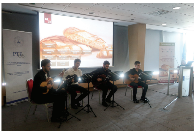
Slika 2 – Svečanost otvorenja savršenom izvedbom uveličao je tamburaški kvartet Akademije za umjetnost i kulturu u Osijeku

međunarodna udruga ISEKI-Food Association (IFA) i međunarodna udruga Global Harmonization Initiative (GHI). Značaj Kongresa ujedno su prepoznale Vladine organizacije i institucije, kao i stručne institucije i udruženja, te je ovogodišnji Kongres održan pod pokroviteljstvom Ministarstva znanosti i obrazovanja, Ministarstva poljoprivrede, Ministarstva gospodarstva, poduzetništva i obrta, Ministarstva zaštite okoliša i energetike, Ministarstva zdravstva, Županije Osječko-baranjske, Grada Osijeka, Akademije tehničkih znanosti Hrvatske, Sveučilišta Josipa Jurja Strossmayera u Osijeku, Hrvatske gospodarske komore i Hrvatske udruge poljodavaca. Uz navedeno, čak 13 predstavnika izlagača laboratorijske i procesne opreme prepoznali su značaj Kongresa te ga sponzorski poduprli pri čemu nam je čast posebno izdvojiti zlatne sponzore Kongresa TIM ZIP d. o. o. (Hrvatska) i Bastak Instruments (Turska), srebrnog sponzora Bosch Packaging Technologies (Njemačka), te brončane sponzore Ru-Ve d. o. o. (Hrvatska), Labena d. o. o. (Hrvatska), AlphaChrom d. o. o. (Hrvatska) i Actor d. o. o. (Slovenija). Na tomu im se, kao i svim ostalim sponzorima, izlagačima i donatorima ovogodišnjeg Kongresa iznimno zahvaljujemo, jer nam je njihova financijska i/ili donatorska potpora omogućila uspjeh Kongresa.