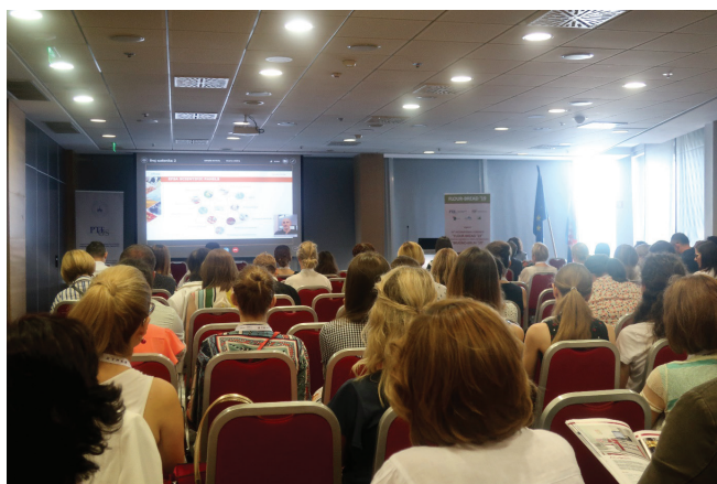
Slika 3 – Videokonferencijsko izlaganje predstavnika Europske agencije za sigurnost hrane (EFSA) o klimatskim promjenama i sigurnosti hrane

Znanstveni program Kongresa obuhvatio je šest plenarnih i 11 pozvanih predavanja, te 14 usmenih i 53 posterska priopćenja. Relativno bogatom znanstvenom dijelu Kongresa znatno je doprinio i stručni program, koji je obuhvatio tri radionice za predstavnike industrije i gospodarstva organiziran u suradnji Prehrambeno-tehnološkog fakulteta Sveučilišta u Osijeku, Ministarstva