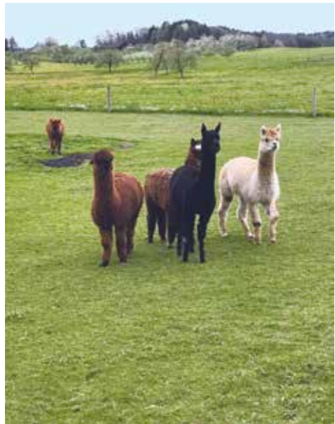
Slika 1. Stado alpaka u Švicarskoj

Alpake ( Vicugna pacos ) i ljame ( Lama glama ) su pripitomljene životinje iz porodice deva koje potječu s južnoameričkih Anda. Njihovi divlji srodnici su vikunja i gvanako (Wheeler, 1995., Wheeler, 2012.). Zbog podatne dugačke vune i ukusnog mesa alpaka je odavna udomaćena u zemljama Južne Amerike gdje danas živi oko 3,5 milijuna jedinki. Danas je, osim u Južnoj Americi, rasprostranjena diljem svijeta (SAD, Australiji i Europi) (Slika 1.). Visina tijela u grebenu iznosi 76-97 cm, a do vrha glave najviše 150 cm. Tjelesna masa im je 55-65 kg, a pojedini mužjaci mogu imati i do 80 kg. Životni vijek alpake je oko 25 godina (Wheeler, 1995.). Šiša ih se jednom ili dva puta godišnje, a dobiva se 2,2-4,5 kg vune na godinu. Alpaka je poligamna vrsta, skupinu čini 5-10 ženki s mladima i dominantni mužjak koji brani teritorij skupine i čuva svoj harem (Wheeler, 2012.).