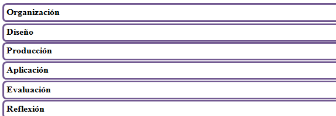
Figura 1: Plan de trabajo

El plan de trabajo se transita durante todo el año y cuenta de 6 etapas concatenadas (Figura1)